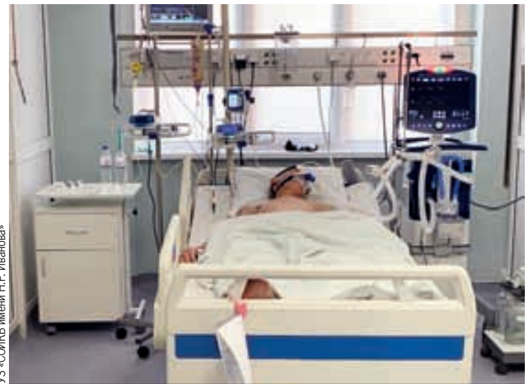
ГУЗ «СОИКБ имени Н.Р. Иванова»

И еще одно важное направление - более широкие возможности для