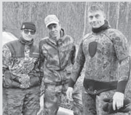
ГУ МЧС России по Якутии

Он бросился спасать подростков, унесенных на льдине.