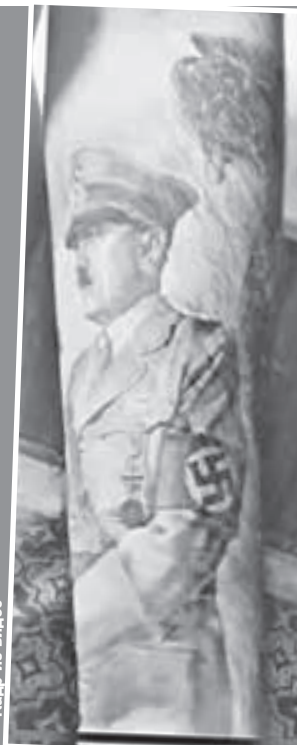
Кадр из видео

Вот этим людям весь «цивилизованный мир» от Ватикана до Вашингтона предлагал помочь всеми возможными способами. Никого ничего не смущает в таких борцах за свободу?