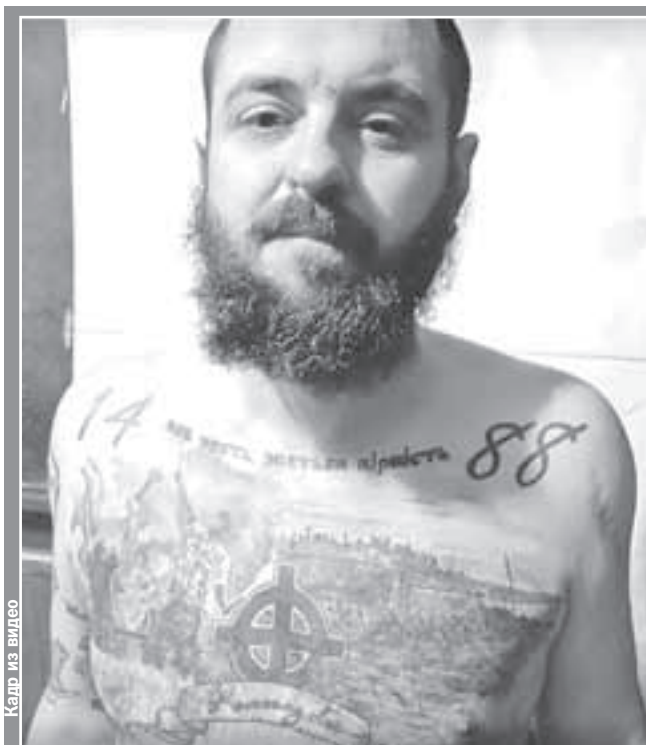
Кадр из видео