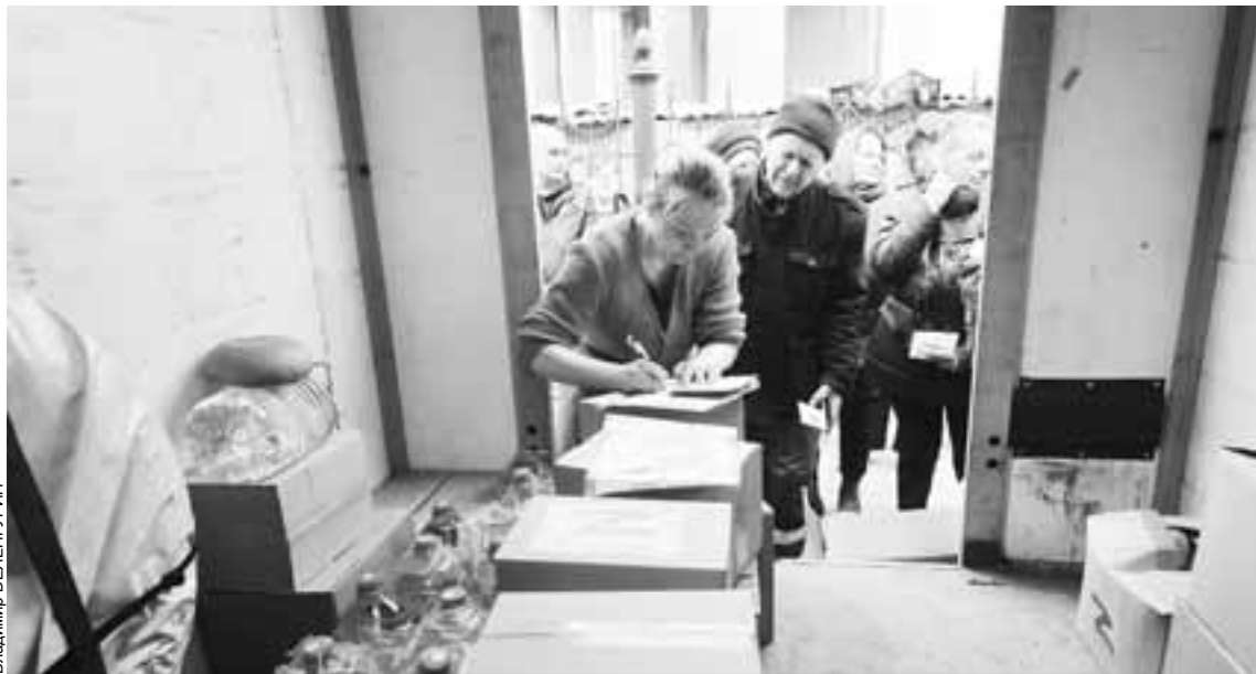
Гуманитарные грузы на территории ДНР и ЛНР поступают со всех регионов России. Вносит свой вклад в это доброе дело и Саратовская область.

В числе таких общественных организаций стоит отметить саратовское отделение «Боевого Братства» и его вклад.