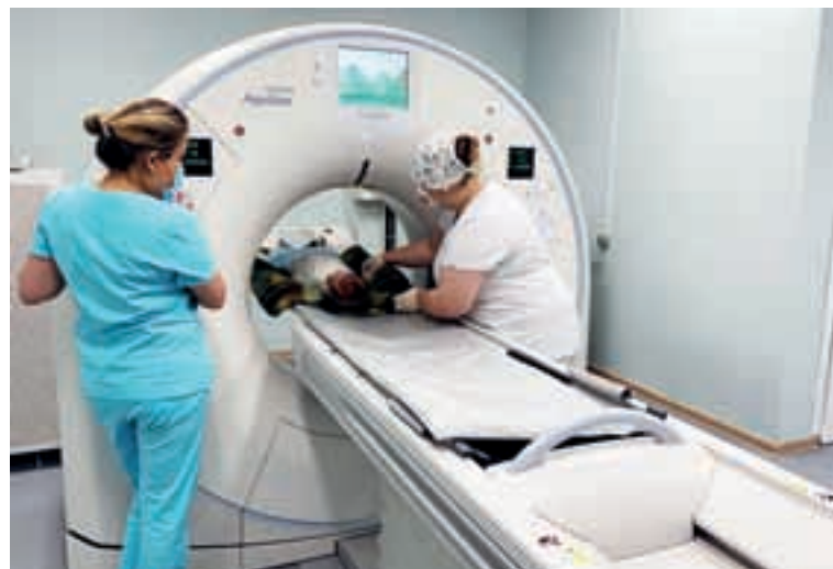
В больнице установлено современное оборудование.