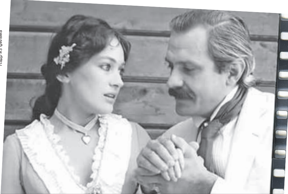
У актрисы нет ничего общего с ее героиней из «Жестокое романса», разве что имя. Гузеева всегда знала, чего хочет от жизни, и в обиду себя не дает. (На фото с Никитой Михалковым, который сыграл роль легкомысленного барина Паратова.)

до университета. Она немного работала секретарем в строительной фирме.