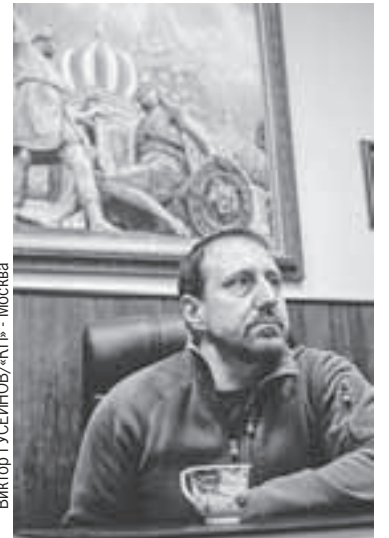
Виктор Гусев/ИТАР-ТАСС - Москва

- Сейчас мы закончим с «Азовсталью», от военных задач там мы перешли к задачам специальным. Нам нужно после выхода пленных все окончательно зачистить и выяснить, не остался ли там кто-то. Мы же понимаем, что противник может оставить там и склады - это не такая уж и фантастика, -