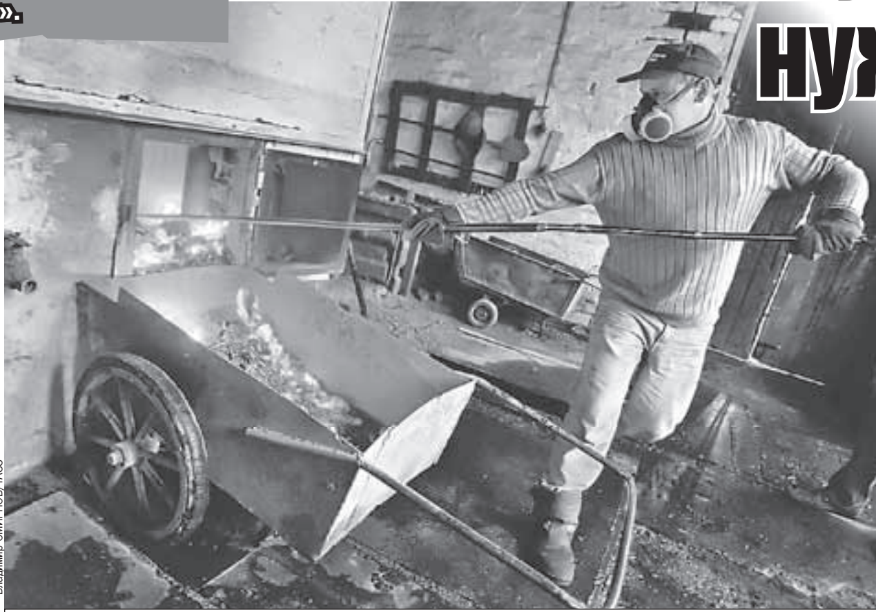
Расход бурого угля - практически как у каменного, а стоит он при этом в полтора раза меньше.

- Налоги и рабочих могло быть больше, - подъезжает совладелец Мунайского разреза