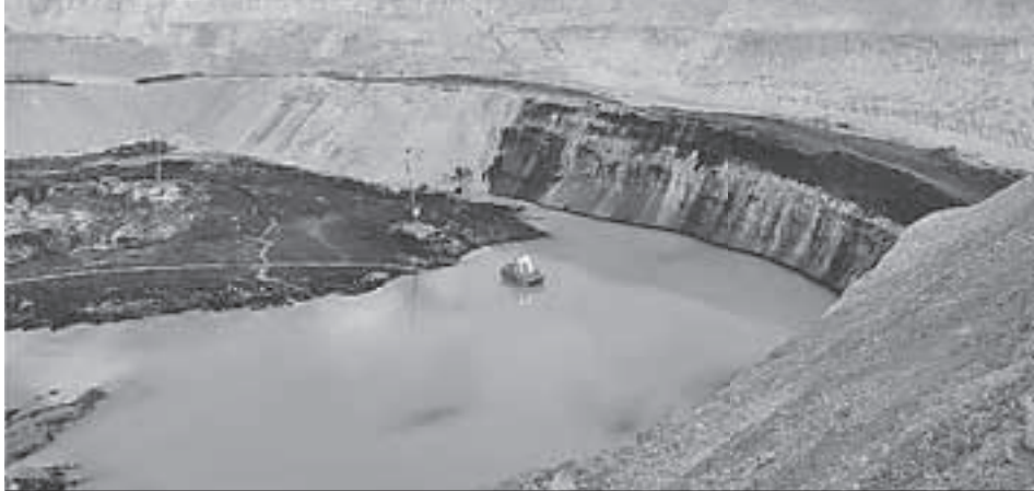
Алексей ОВЧИННИКОВ/«КП» - Москва

Мунайский разрез был открыт еще в XIX веке. Сейчас он стал селообразующим предприятием: дает сотням людей работу, а многим тысячам - тепло.