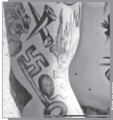
Кадр из видео

Так и шли украинские батальоны с эмблемой дивизии СС «Мертвая голова» (фото сверху), мечта открыться ключом-свастикой дверь в неонацистскую независимую (нижнее фото).