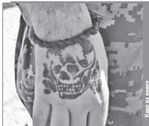
Кадр из видео

Следователям предстоит долгая работа. Скорее всего, самых одиозных персонажей будет судить трибунал в ДНР. Он сейчас формируется. И к этим людям может быть применена