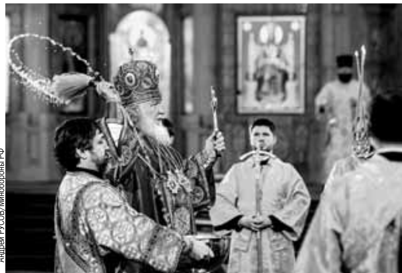
Патриарх Кирилл не только освятил храм, но и стал его настоятелем.

Святейший стал настоятелем храма Минобороны и признался, что нуждается в молитвах верующих.