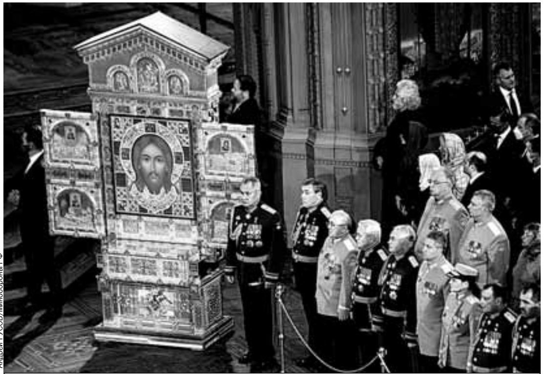
Министр обороны Сергей Шойгу у одной из главных икон храма («Спаса Нерукотворного»), созданной на пожертвование Президента России.

Для наших левых партий, для наших оппонентов в коммунистической партии слово «диктатура» является органичным, потому что они всегда выступали за диктатуру пролетариата, и на самом деле это была диктатура одной партии, ее власть, ее монополия была напрямую закреплена в Конституции СССР 1977 года.