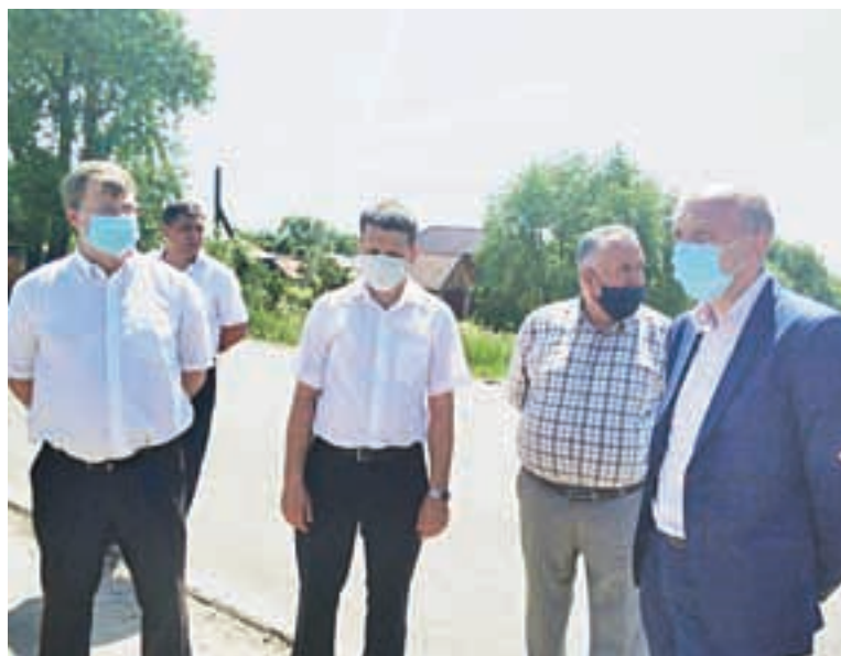
Представители региональной и районной власти, фирмы-подрядчика, общественники и жители Петровска осмотрели ремонтируемый участок дороги.

в рамках нацпроекта «Безопасные и качественные автомобильные дороги». Акция приурочена к 75-летию Победы в Великой Отечественной войне и предусматривает приведение в нормативное состояние городских улиц, названия которых связаны с этой датой. Речь, к примеру, идет о городских улицах, проспектах или площадях, названных в честь Дня Победы или героев Великой Отечественной войны, требующих проведения ремонта или обустройства. - Конечно, большинство улиц, которые принимают участие в акции, в нашей области находятся в Саратове или Энгельсе. Но присоединился к проекту и Петровск. Спасибо за это администрации района и депутатскому корпусу,