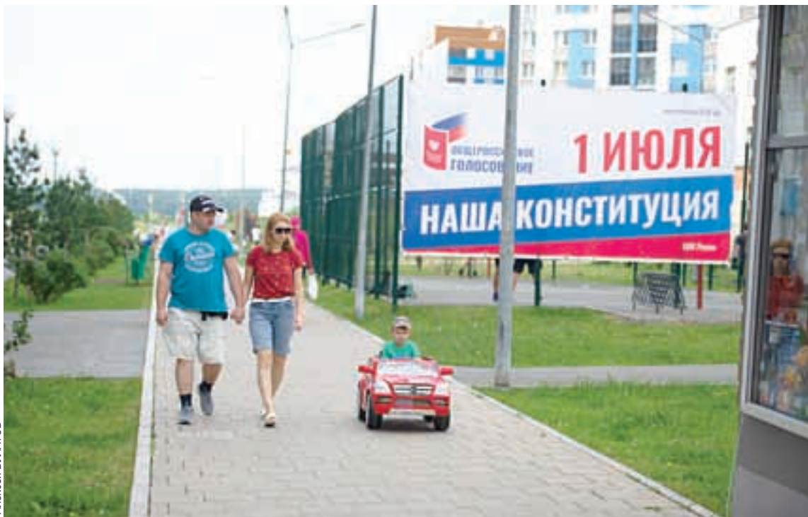
Поправки в Конституцию затрагивают интересы всех граждан России.

«В Российской Федерации формируется система пенсионного обеспечения граждан на основе принципов всеобщности, справедливости и солидарности поколений и поддерживается ее эффективное функционирование, а также осуществляется индексация пенсий не реже одного раза в год в порядке, установленном