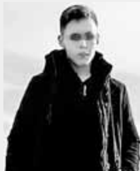
Подросток заключен под стражу.