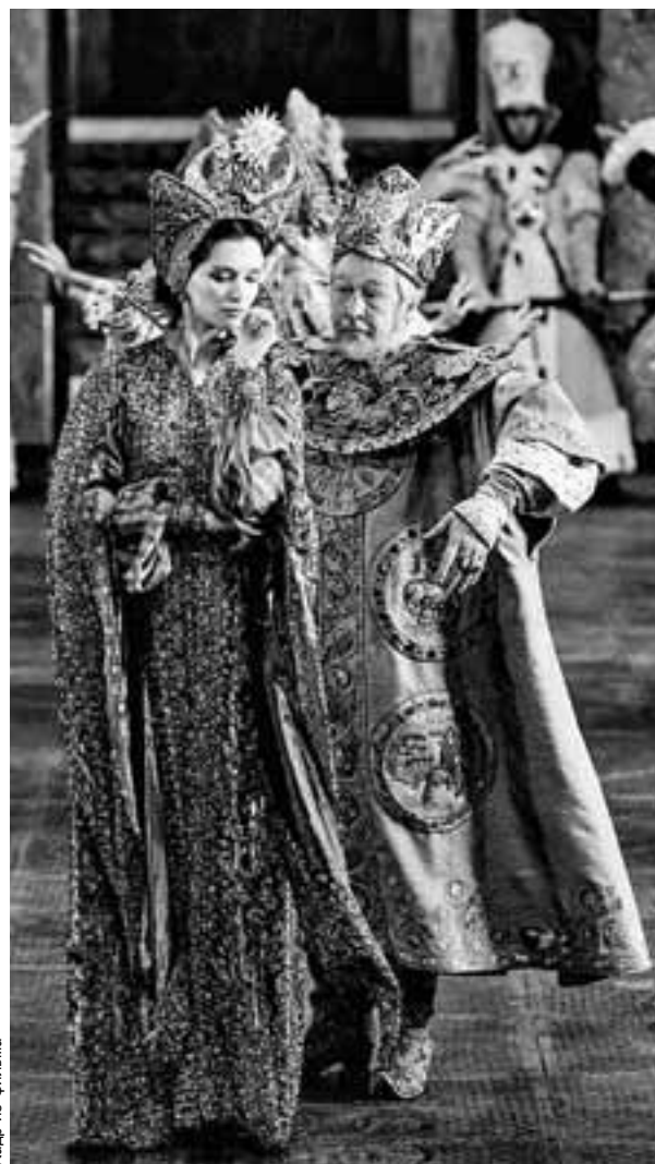
Одна из недавних работ Ефремова в кино - роль царя в сказке «Конек-горбунок» (в кадре с Паулиной Андреевой).

В год у Ефремова выходило не больше трех кинопроектов. В 2020 году это фильмы