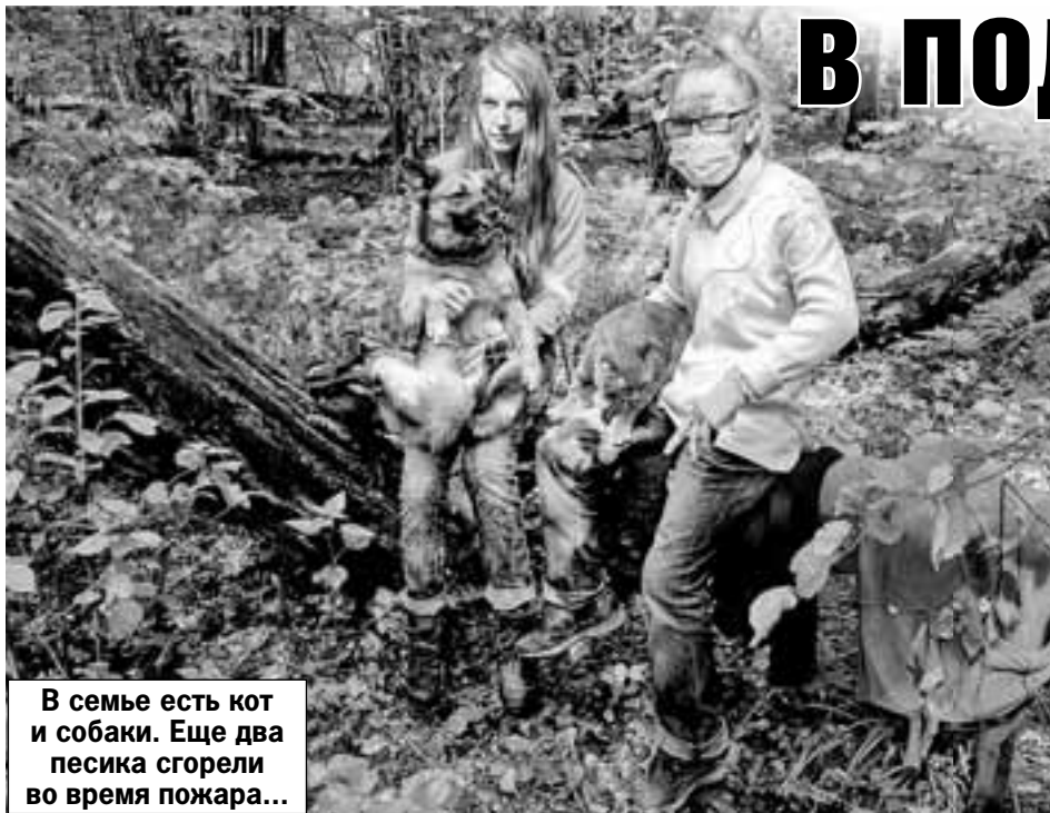
В семье есть кот и собаки. Еще два песика сгорели во время пожара...

От Белорусского вокзала до поселка Дубки 40 минут на электричке. По обе стороны от станции добротные особняки доминируют над облупившимися советскими дачами. Поселок граничит с Можайским шоссе, перебежав через кото-