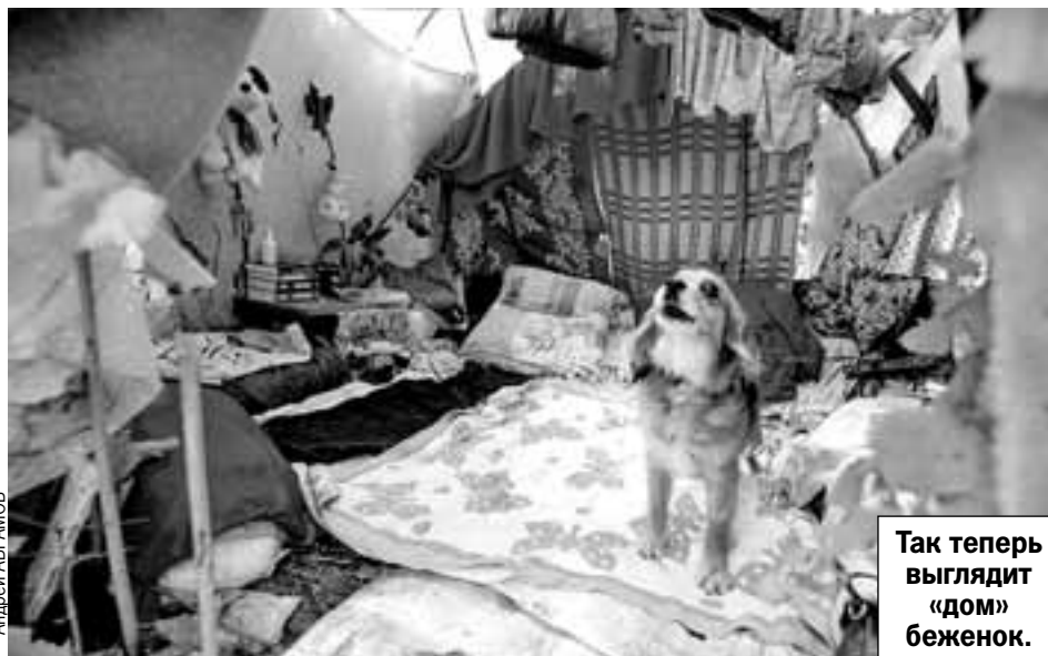
Так теперь выглядит «дом» беженок.

За одеждой ездили в храм в Одинцово. Зимой - на Белорусский или Курский вокзалы помыться.