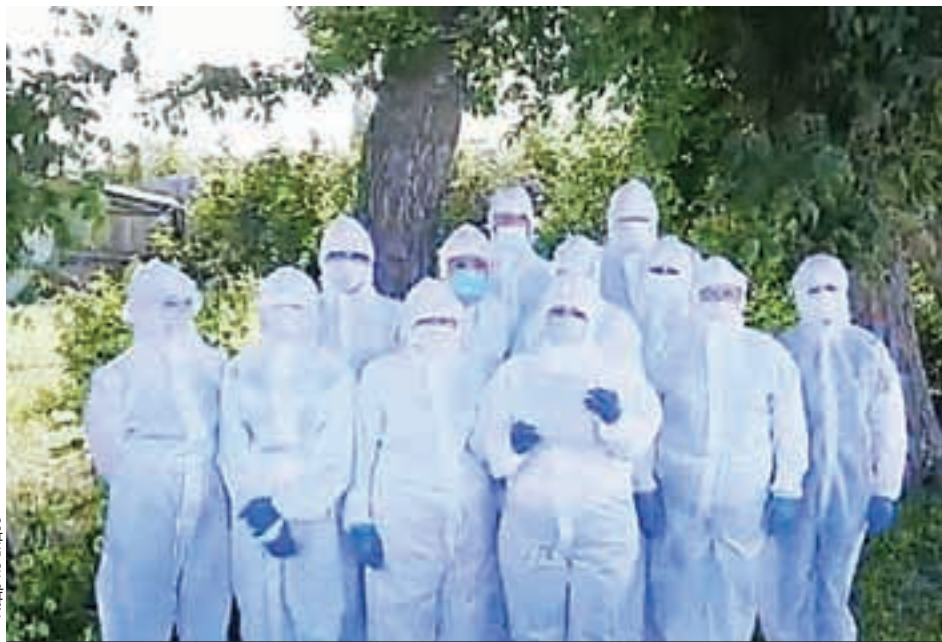
Кадр из видео

Напомним, ранее с похожим обращением выступили сотрудники Энгельсской