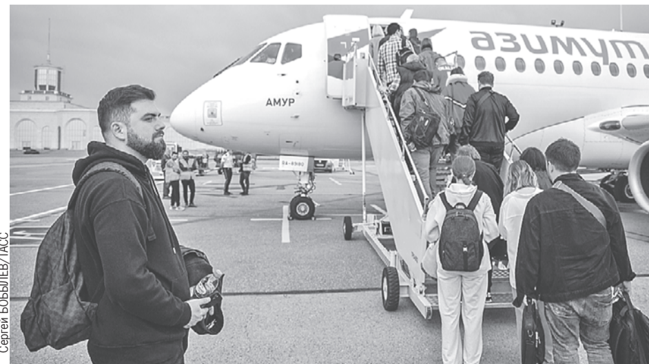
Пассажиры самолета Super Jet 100-95B «Амур» российской компании «Азимут» в Москве не ждали, что в аэропорту Тбилиси не все будут им рады.

*Здравствуйтесь, россияне - по-грузински.