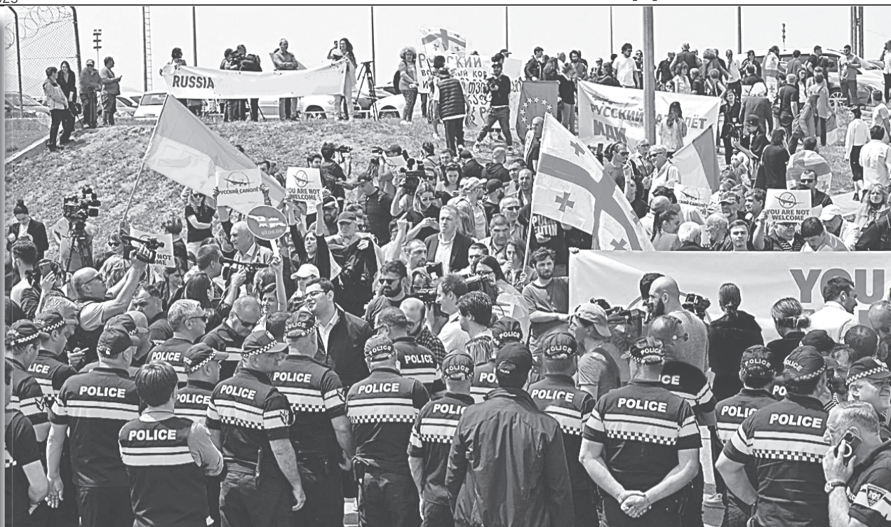
Не более 200 - 300 человек с флагами Грузии, Украины и антироссийскими лозунгами добрались пешком из Тбилиси до аэропорта, в здание которого их не пустила полиция.

Как Грузия встретила первый после 4-летнего перерыва самолет из России. Спецкор «КП» с трудом просочилась в аэропорт Тбилиси, где порадовалась спокойствию полицейских, порадовалась за пассажиров и нарвалась на хамство местных журналистов.