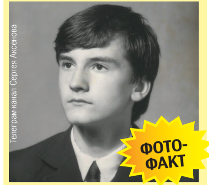
Телеграм-канал Сергея Аксенова