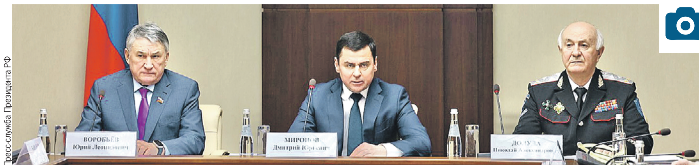
Пресс-служба Президента РФ