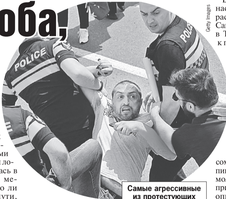
Самые агрессивные из протестующих до аэропорта им. Руставели не добрались.