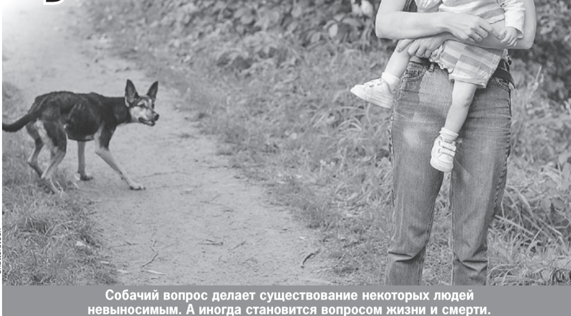
Собачий вопрос делает существование некоторых людей невыносимым. А иногда становится вопросом жизни и смерти.

потому что один человек может ошибаться.