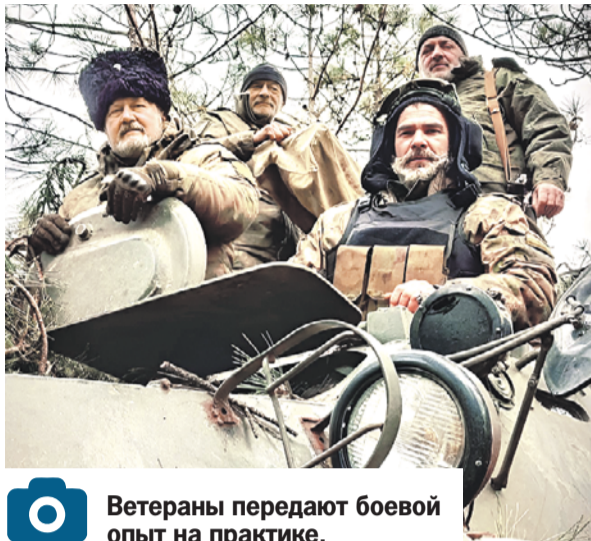
Ветераны передают боевой опыт на практике.

- Претерпели изменение и дополняются в основном пункты Стратегии, связанные с несением казаками государственной и иной службы и патриотическим воспитанием под-