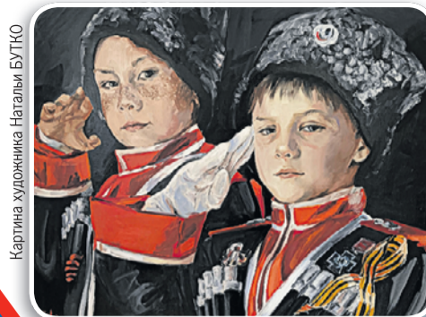
Картина художника Натальи БУТКО