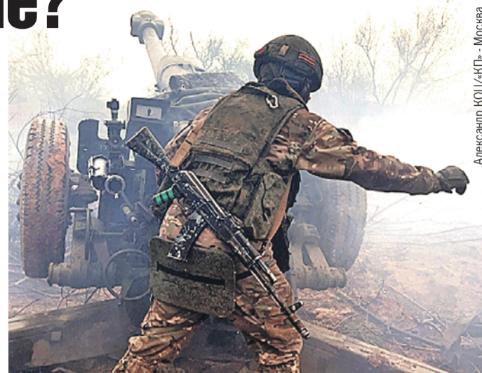
Александр КОЦ - КП - Москва

А пока, в день освобождения Мариуполя, Бахмут опять стал Артемовском.