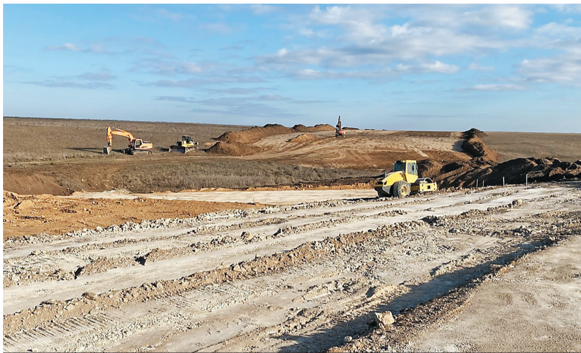
Трасса будет начинаться в районе Донского и выходить ближе к селу Перевальное.