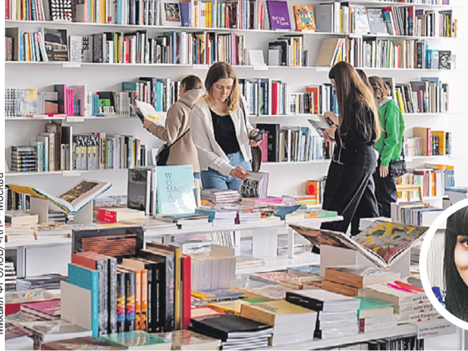
Михаил ФРОЛОВ «КП» - Москва

Издатели отмечают, что сегодня молодежная аудитория обеспечивает рост всего сегмента художественной литературы.