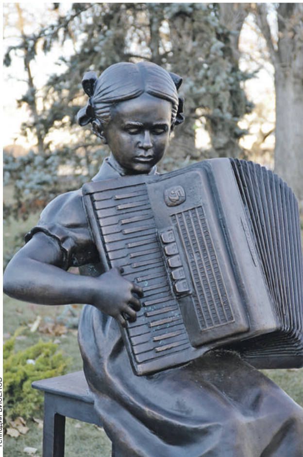
Пять лет назад в Волгограде установили скульптуру «Девочка с аккордеоном», в которой легко угадывается маленькая Аля Пахмутова.

- Секрета нет, просто любить. Николай Николаевич всегда приводил в пример цитату Антуана де Сент-Экзюпери: «Любить - это не значит смотреть друг на друга. Любить - это значит смотреть вместе в одном направлении». Именно так мы и жили, и я сейчас продолжаю жить.