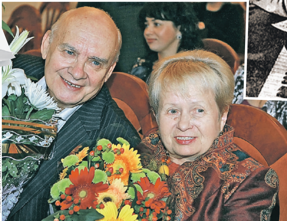
Николай Добронравов и Александра Пахмутова прожили вместе 67 лет, но говорить о своем браке не любили, за них это делали их песни.

9 ноября композитору, народной артистке СССР Александре Пахмутовой исполнилось 95 лет.