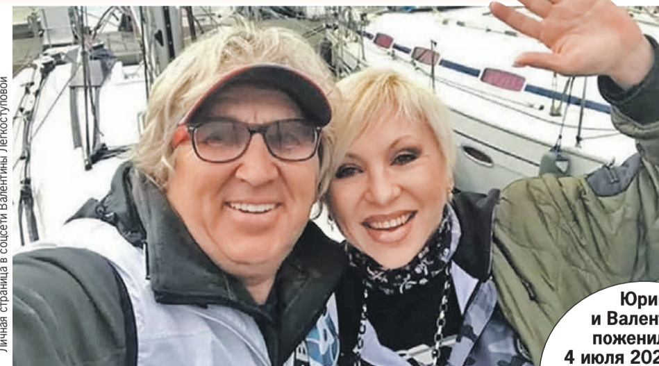
Личная страница в соцсети Валентины Легкоступовой