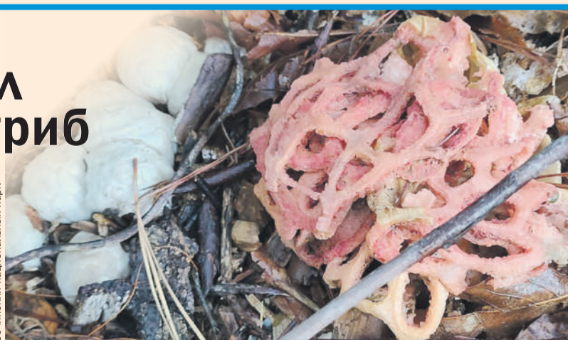
Клатрус - так называется гриб, необычной формы и очень неприятно пахнет.

Весной 2024 года решеточник буквально захватил Краснодарский край. Доселе неведомые в регионе грибы уже заметили на Утрише, в кубанских лесах и в Сочи. Первое время клатрус считали ядовитым. Но ученые изучили пришельца и выяснили, что он без-