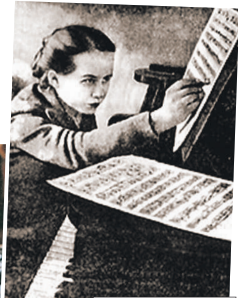
Военное детство не помешало Пахмутовой реализовать свою мечту о музыке.

- Да, это правда. Вся моя семья положила