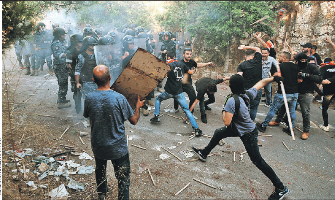
Так уж вышло, что самые яркие протесты против действий Баку в Карабахе происходили вдали от Кавказа - вот такие столкновения случились в Бейруте у посольства Азербайджана.

Журналист «Комсомолки» попытался обобщить взгляды из армянского и азербайджанского окопов на то, что стряслось в Карабахе, которого больше нет.