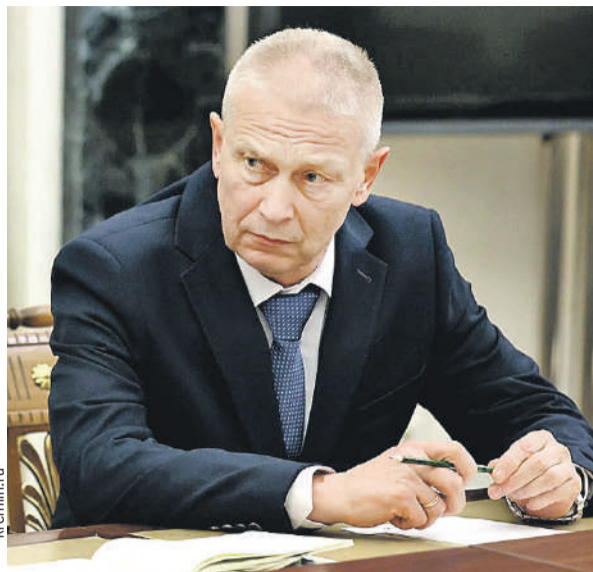
На встрече с Путиным и Юнус-Бекком Евкуровым в Кремле полковник Андрей Трошев был предельно собран и конкретен.

Почему именно на этом офицере Путин остановил свой выбор? Трошев вместе с «родоначальниками