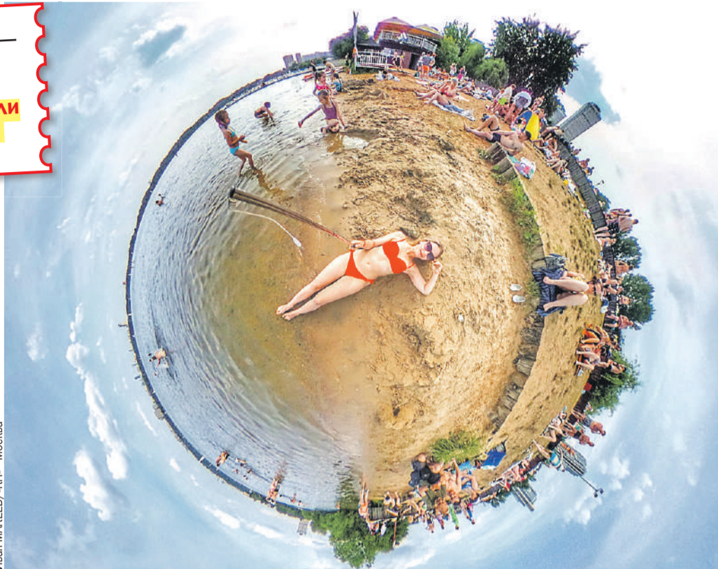
Что такое лето? Это море! Черное, Балтийское, Каспийское... и даже Японское!

- Ключевой для нас показатель - число туристических поездок. Он у нас вырос за май - август почти на 16%. И по сравнению с прошлым летом на 5 миллионов турпоездки люди совершили больше, - сообщил глава Минэкономразвития Максим Решетников (учитывают именно поездки, а не туристов - если вы летом слетали в Сочи на неделю и съездили на выходные в Плес, то попали в статистику дважды).