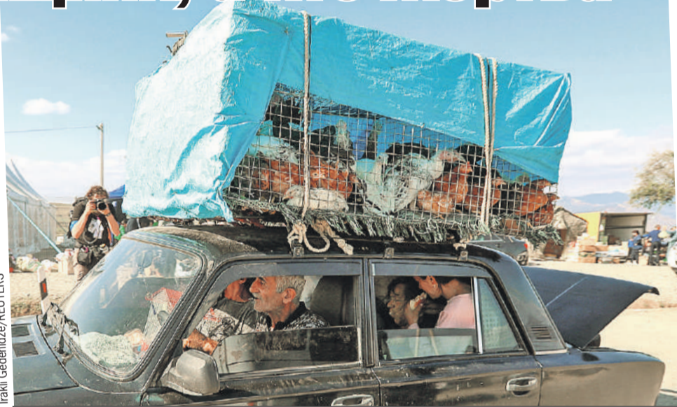
Армяне из Карабаха вывозят все, что могут, в том числе и братьев наших меньших...

Ведь что бы ни происходило в отношениях Москвы и Еревана, в первом случае выигрывают интересы и самой России, и Армении. Во втором - интересы кого угодно, только не народов этого горячего региона - ни армян, ни азербайджанцев, ни грузин. Их начнут раздирать в разные стороны и стравливать. Так в истории было всегда. В этом как раз нет никаких сомнений.