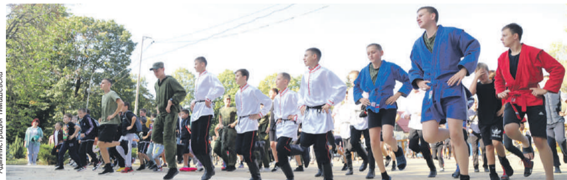
Разминка перед велопогулкой.