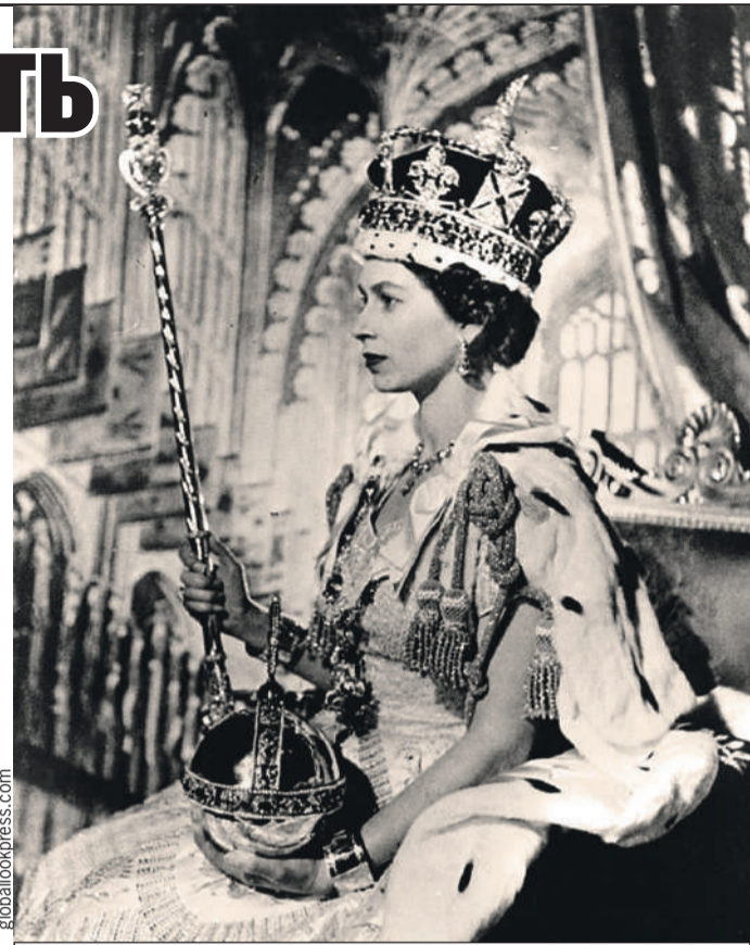
Коронация Елизаветы II прошла 2 июня 1953 года в Вестминстерском аббатстве Лондона. Теперь корона, скипетр и держава перейдут к новому королю.

В четверг у гроба Елизаветы II будут ее дети. Похороны состоятся 19 сентября. Под благословения архиепископа Кентерберийского и гимн «Боже, храни королеву» тело опустят в склеп.