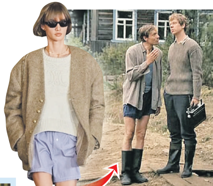
Василий («Любовь и голуби», 1984) и показ бренда Celine (2022)

- Вот уж и правда нарочно не придумаешь: Василий в своем неказистом наряде выглядит, как нынешние хипстеры. Модель андрогинной внешности лишь подчеркивает тенденцию последних лет на нивелирование различий между полами. Думаю, что шорты, стилизованные под семейные трусы, здесь элемент эпатажа: дизайнер решил немного взбудоражить публику. А вот грубые сапоги сегодня действительно в тренде.