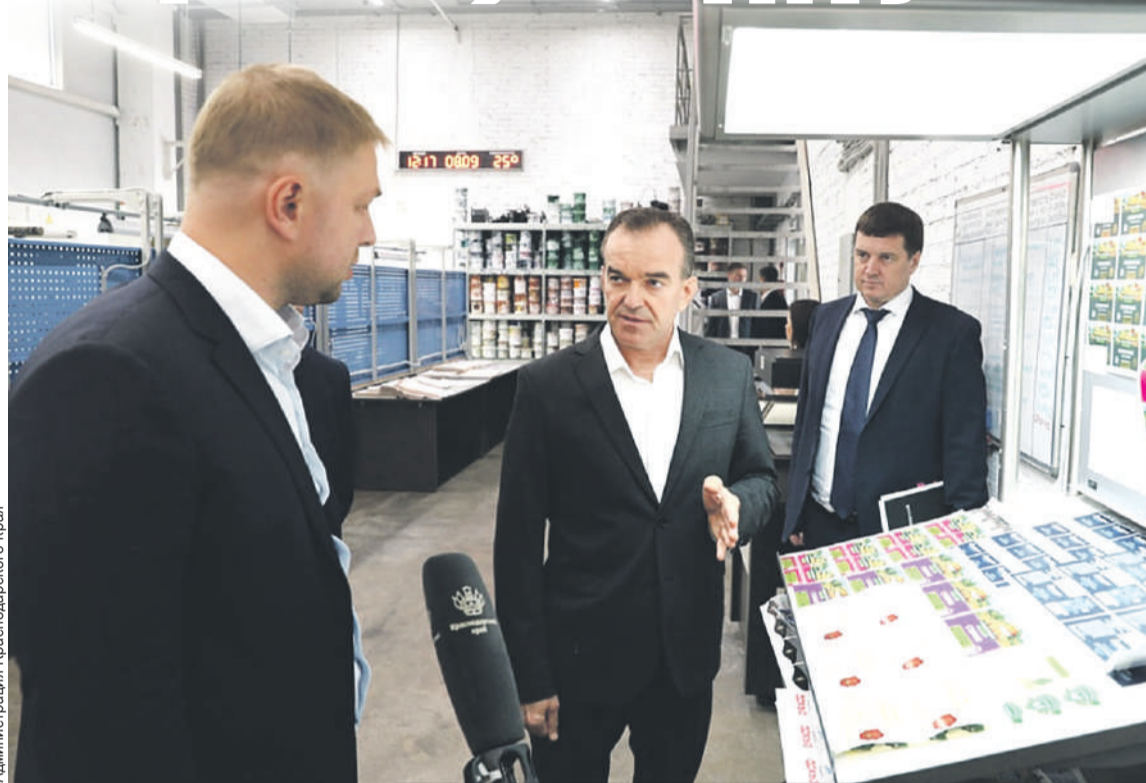
Администрация Краснодарского края