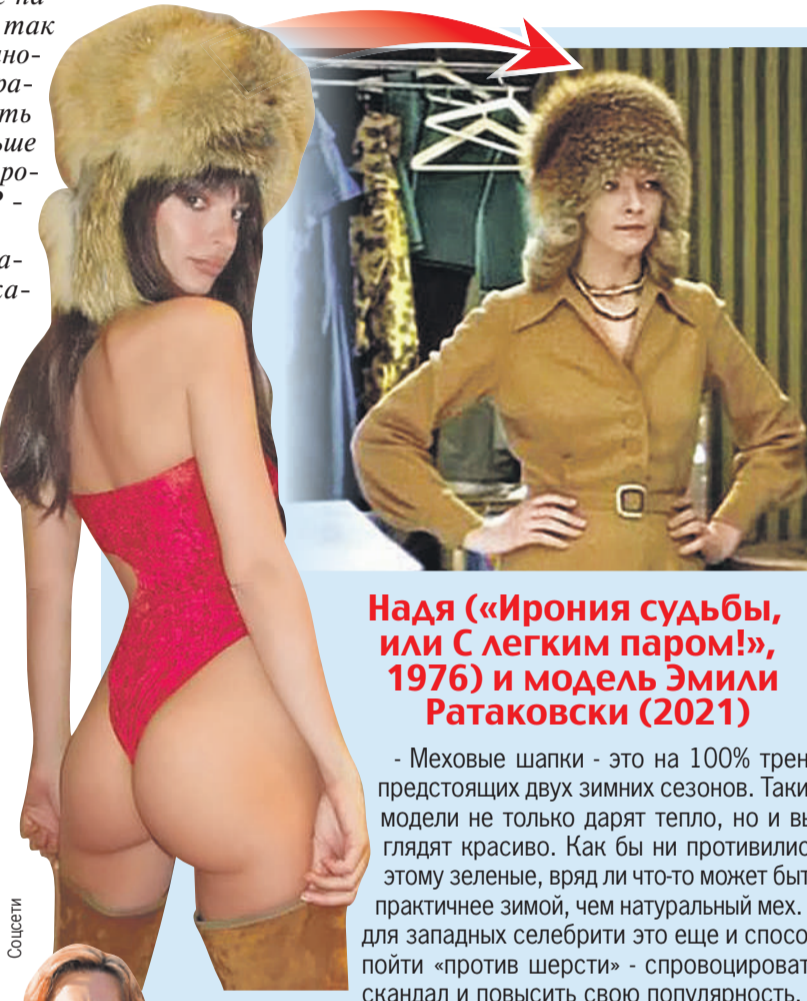
Надя («Ирония судьбы, или С легким паром!», 1976) и модель Эмили Ратаковски (2021)

- Меховые шапки - это на 100% тренд предстоящих двух зимних сезонов. Такие модели не только дарят тепло, но и выглядят красиво. Как бы ни противились этому зеленые, вряд ли что-то может быть практичнее зимой, чем натуральный мех. А для западных селебрити это еще и способ пойти «против шерсти» - спровоцировать скандал и повысить свою популярность.