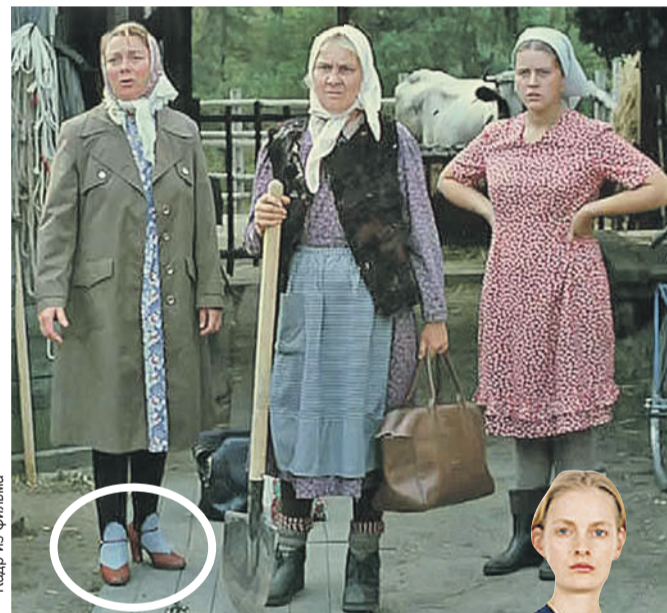
Надежда («Любовь и голуби», 1984) и коллекция Balenciaga (2017)

- Надежда действительно опередила время: тренч, гамаша со штрипками и туфли на каблуках на носки - суперхит последних нескольких лет. Впрочем, даже сегодня такое подойдет далеко не всем, а лишь самым отвязным модникам. И «Баленсиага», как из самых модных брендов среди молодежи, это хорошо понимает. В России такой смелый образ сейчас могла бы примерить разве что молодая жена Евгения Петросяна Татьяна Брухунова. А обычные люди решили бы, что эти модники некрещенные, вот и бесятся.