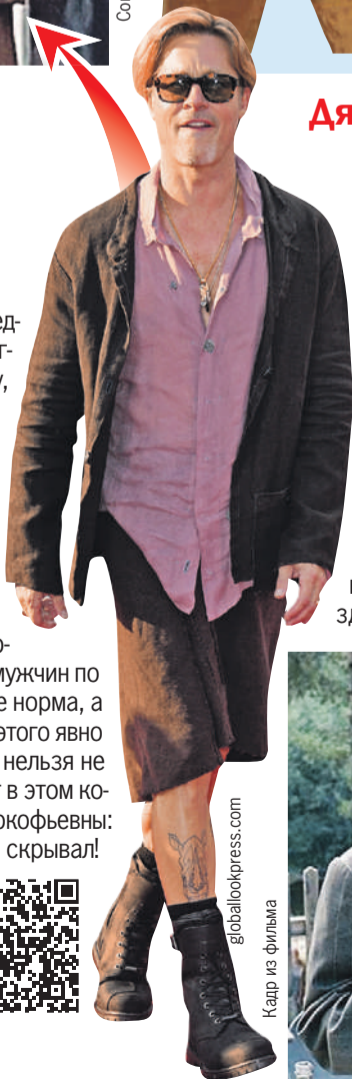
Дядя Митя («Любовь и голуби», 1984) и показ модельера Жан-Поля Готье (2022)

- Если честно, я слабо представляю, что может сподвигнуть мужчину надеть юбку, разве что нет возможности носить штаны по каким-то физиологическим причинам... В случае с Брэдом Питтом невольно закрадывается мысль о смене пола вслед за дочерью, которая какое-то время чувствовала себя мальчиком. Но отбросим домыслы. Юбка среди мужчин по всему миру - по-прежнему не норма, а способ привлечь внимание, этого явно и добивался актер. Кстати, нельзя не отметить, что Питт выглядит в этом костюме не хуже Людмилы Прокофьевны: какие ножки, оказывается, скрывал!