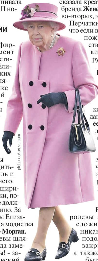
Королева надевала цветные наряды, чтобы подданные могли заметить ее издали.

В одежде у королевы за долгие годы сложились правила: никаких мини-юбок, подол всегда должен закрывать колени, а также в нем должна быть вшита лента-«утяжелитель», чтобы исключить конфуз в стиле Мэрилин Монро. И никаких брюк, по крайней мере на публичных мероприятиях.