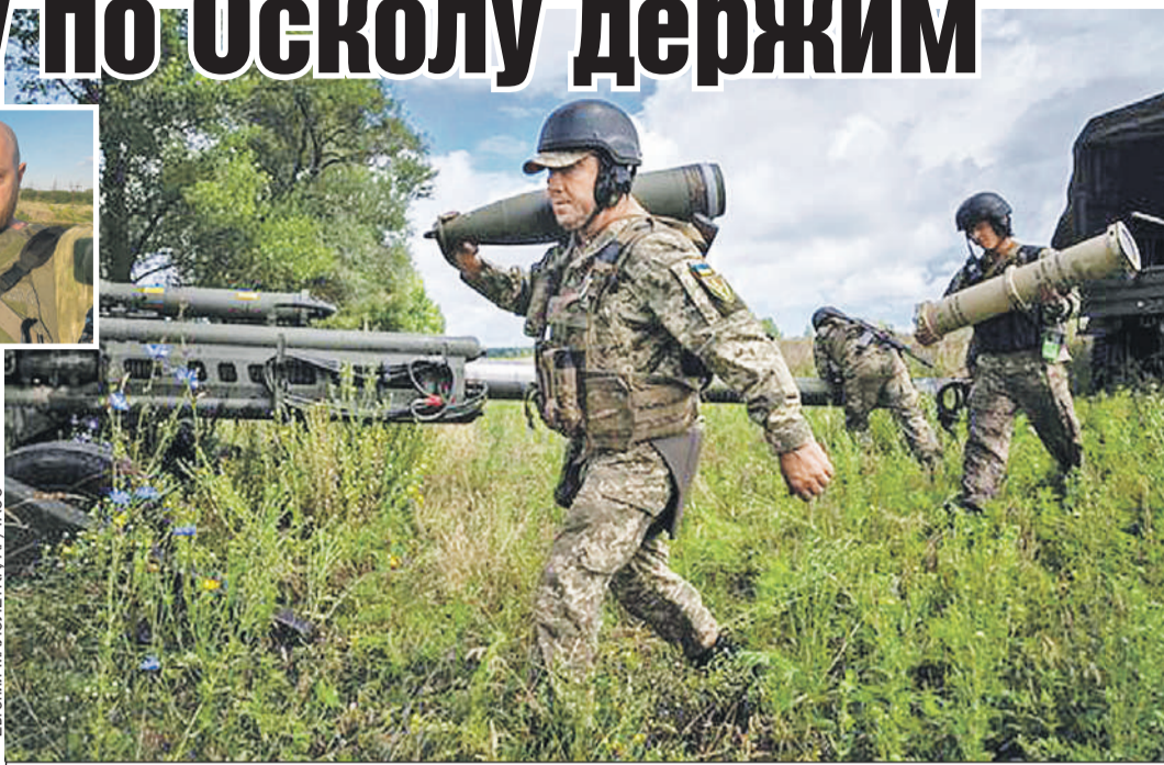
Украинские военные шагают по Харьковщине в немецких шлемах, с американской гаубицей M777 и снарядами ценной 3 млн рублей каждый (в тубусе).

Врагу удалось занять сначала Балаклею, а затем отрезать нашу группировку в городе Изюм от путей снабжения. В это же время противник, не считаясь с потерями и бросая в бой все новые и новые резервы, вышел к Купянску. Вся наша изюмская группировка, которая последние месяцы вела бои к северу от