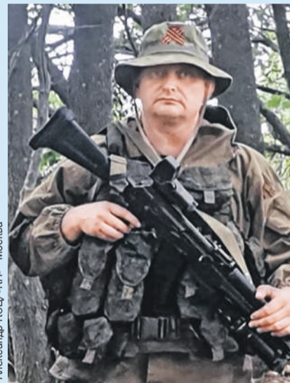
Александр КОЦ/«КП» - Москва

«7 сентября со стороны на нас пошла пехота наемников (слышна была только иностранная речь) - человек 20 - 30 без техники на роту, которой командовал «Рязань». Атаку отбили. Но число наемников