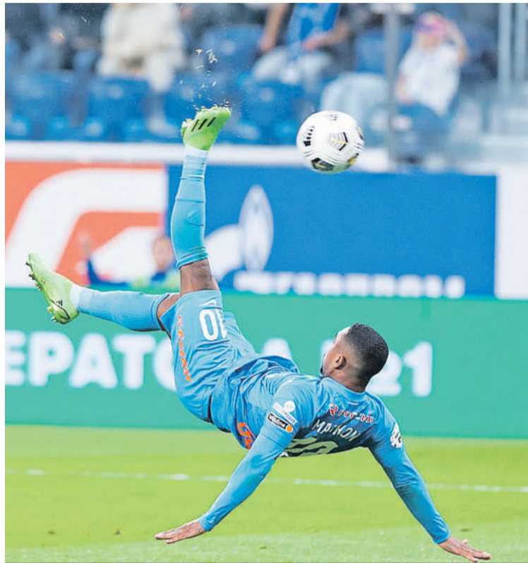
Футболисты «Зенита» покуражились над «Оренбургом», забив ему восемь безответных мячей.

«Зенит» учинил разгром «Оренбургу» (8:0), и было не так уж приятно наблюдать за тем, как Малком и Ко издеваются над клубом-сателлитом. Всем очевидно, что «Зенит» на голову сильнее своих ближайших соперников и на три - аутсайдеров Российской премьер-лиги. Клуб из Санкт-Петербурга почти никого не потерял из своего состава, наоборот, перезаключил контракты со своими легионерами. Но возникает вопрос: зачем сейчас