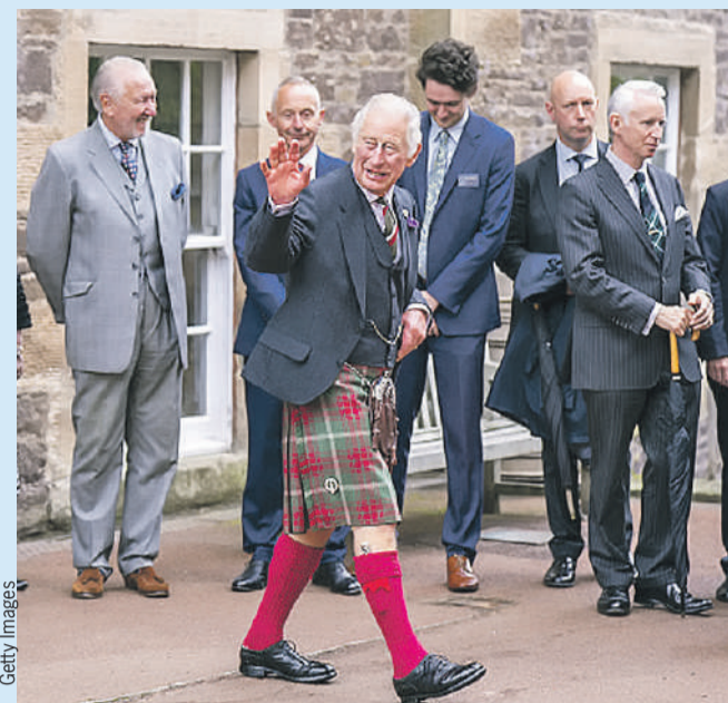
Во время посещения Шотландии принц Чарльз всегда надевал килт, чтобы выказать свое уважение к северянам.