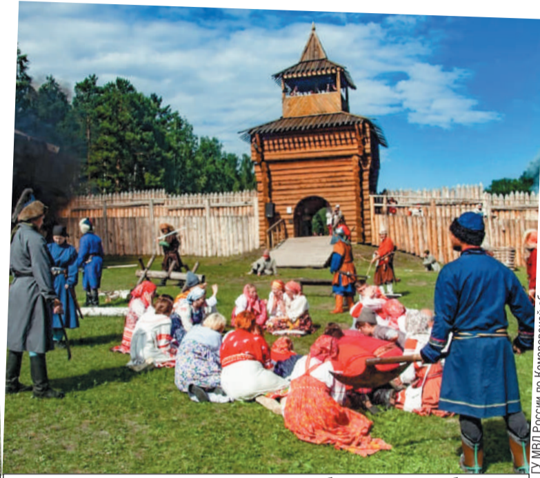
...налетели кочевники, мужчин побили, девок забрали в полон, но отбили всех служилые люди.