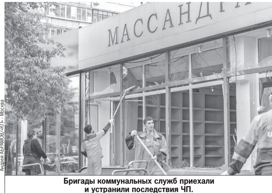
Бригады коммунальных служб приехали и устранили последствия ЧП.

Дом на Комсомольском проспекте находится в 300 метрах от главного здания Минобороны на Фрунзенской набережной. А подавленный сред-