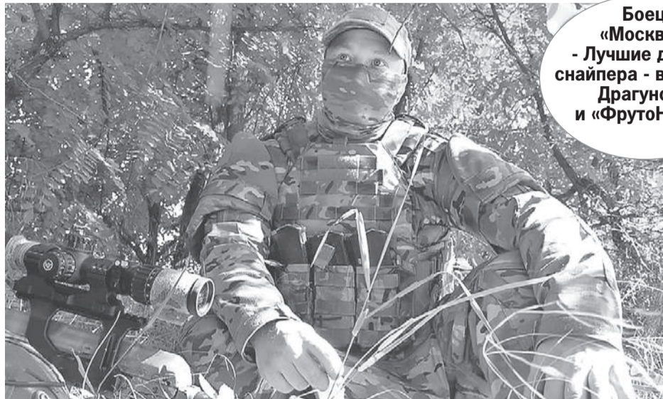
Дмитрий СТЕШИН/«КП» - Москва

Когда я подъехал, снайпер с позывным «Москва» уже был с ног до головы в «упаковке». Судя по СВД (снайперская винтовка Драгунова. - Ред.), он собирался не на охоту. Для охоты у него другое устройство калибра 12,7 и длиной метра три. Я угадал: