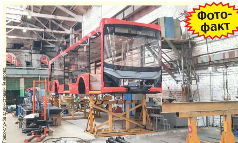
Пресс-служба администрации Кемерова.

Вопросы для губернатора принимаются по многоканальному телефону 8 (3842) 900-399 с 14.00 до 17.00, в день эфира - с 9.00 до конца прямой линии.