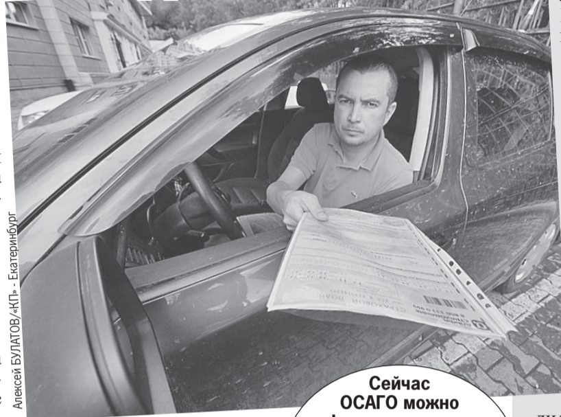
Алексей БУЛАТОВ/КП - Екатеринбург

Теперь закон отправится на утверждение в Совфед и на подпись президенту. И вступит в силу через 210 дней после официального опубликования, то есть не раньше следующей весны.