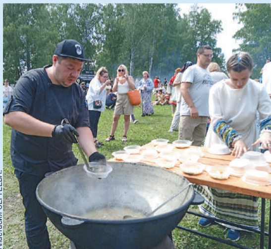
Необычный суп, которым угощали гостей фестиваля, оказался очень вкусным и сытным.

«Уха из петуха» - это не миф вроде «каши из топора», а вполне популярное блюдо казачьей кухни, которое