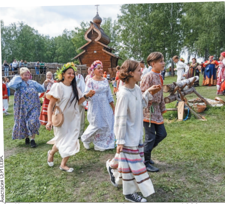
На фестивале воссоздали события далекого 1639 года, когда в разгар веселья на Кузнецком торге...