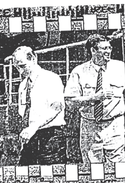
Ровно 20 лет назад Владимир Путин впервые пришел в «Комсомолку».

- А как же командуете генералами? - Мы не в армии, и мы не командуем. Никто не шелкает саблукими, у нас другой стиль. Это же касается меня... Я остался служить в КГБ подполковником. Когда снова перевели на Лубянку, мог практически сразу получить генерала. Но ду-