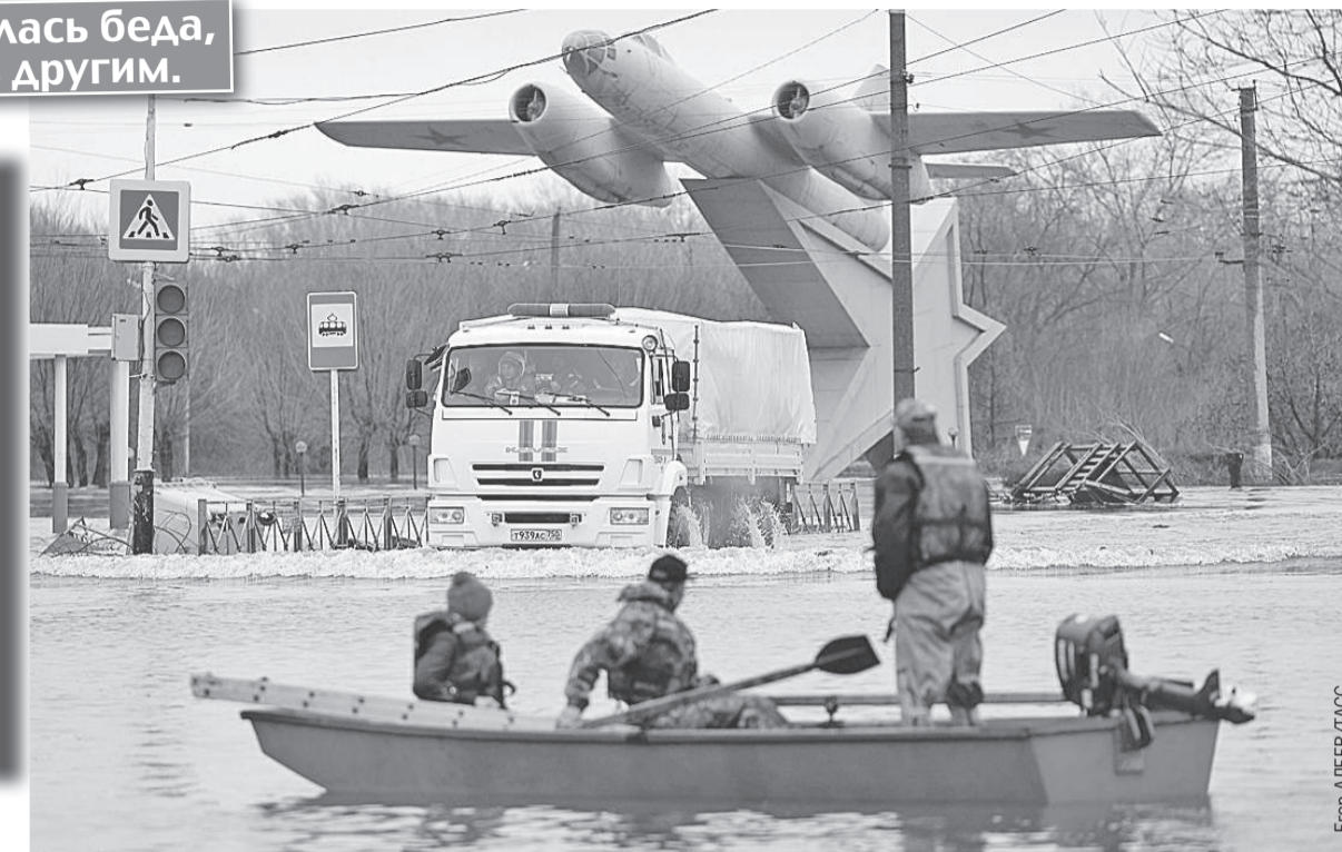
Спасатели вывозят пострадавших на лодках. Уровень воды в некоторых районах Орска выше 4 метров.