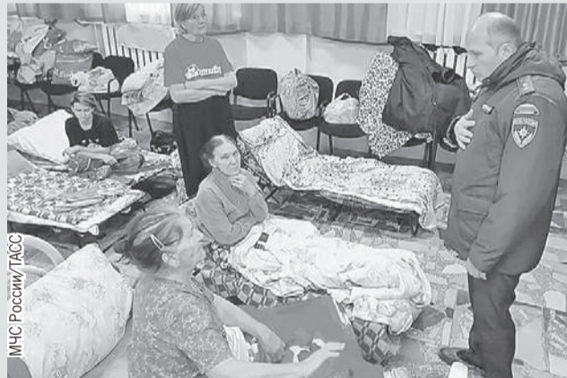
Глава МЧС Александр Куренков навестил людей в пункте временного размещения.

Кроме того, Путин поручил главе МВД не допустить мародерства в районах бедствия. И обеспечить охрану порядка, а также имущества граждан.