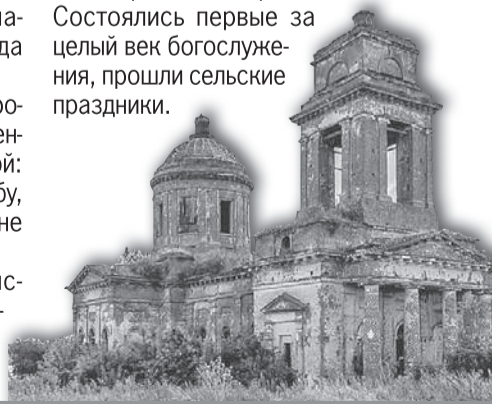
Храм Богоявления Господня расположен в селе Донская Негачевка Хлевенского района Липецкой области.

Благодаря проекту в поселке Грибоедово Тульской области над обезглавленным храмом появилась крыша, в селе Каменка Ленинградской области создан чертеж, по которому воссоздадут часть церкви. Для Георгиевского храма в Ивановской области проведено 3D-сканирование и разработан проект консервации. Состоялись первые за целый век богослужения, прошли сельские праздники.