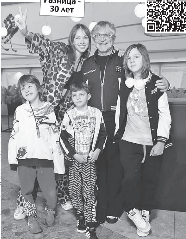
Личная страница Полины Дибровой в социальной сети