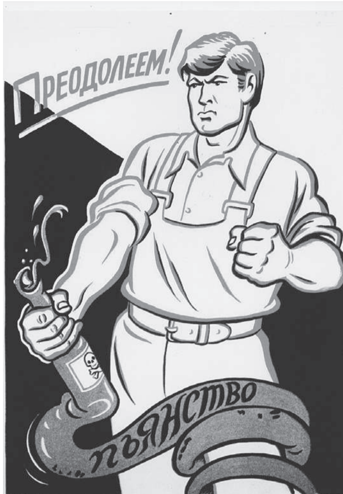
Врачи единодушны: алкоголь - яд. Поэтому если и принимать его, то в маленьких дозах.

Обратите внимание: даны цифры чистого спирта. Для конкретного алкоголя их нужно будет пересчитать в зависимости от крепости напитка.