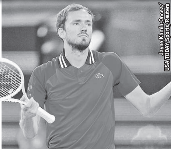
Даниил Медведев: «А меня-то за что в иноагенты, я вам что – Алла Пугачева?»

«В жизни каждый человек имеет право на свое мнение – так же как я имею право быть с ним не согласным. У всех свои причины думать так, а не иначе. Со своей стороны, повторяю: если будет возможность – с удовольствием пое-