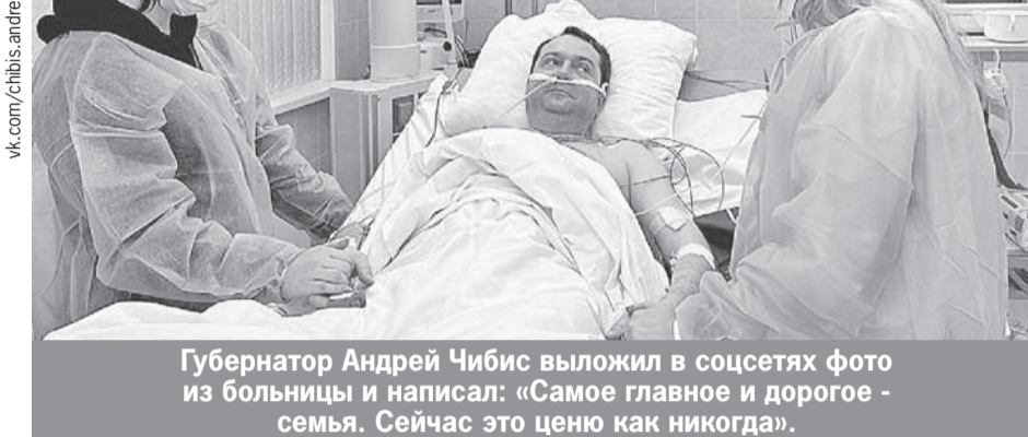
Губернатор Андрей Чибис выложил в соцсетях фото из больницы и написал: «Самое главное и дорогое - семья. Сейчас это ценю как никогда».