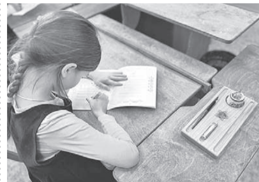
Семейный центр «Ладимир».

В Великом Новгороде создали классы по программе Русской классической школы.