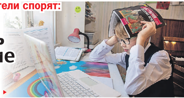
Николай ОБЕРИЧЕНКО/«КТ» - Пермь