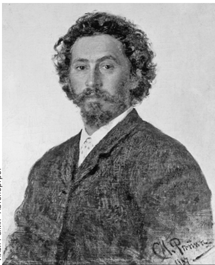
Илья Репин «Автопортрет»