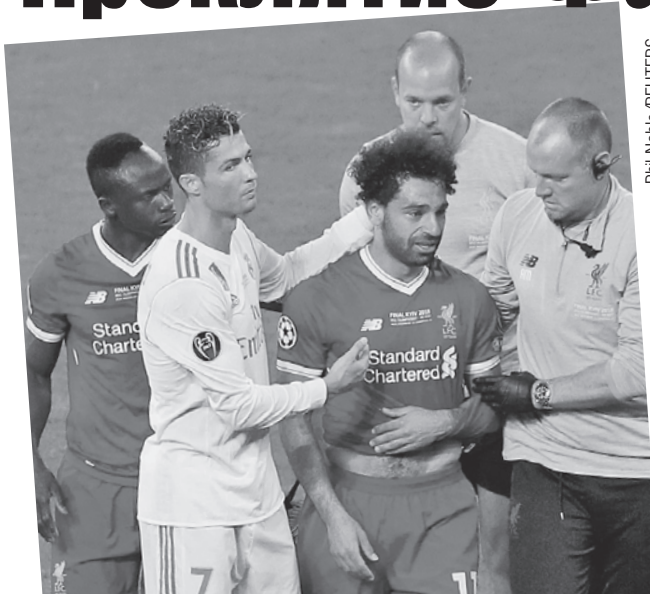
Криштиану Роналду (второй слева) поддержал Мохамеда Салаха, когда того уводили с поля.

чество требующих расправы росло. Впрочем, в самом документе не указано, какого именно наказания заслуживает Серхио Рамос. «Серхио Рамос представляет собой ужасный пример для будущих поколений футболистов. Вместо справедливого выигрыша он использует трюки, которые бросают вызов духу игры и честной игре, - говорится в петиции. - УЕФА и ФИФА должны принять меры против