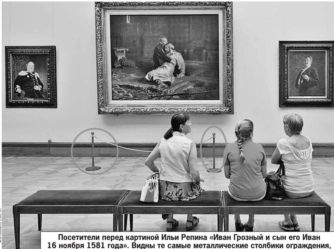
Посетители перед картиной Ильи Репина «Иван Грозный и сын его Иван 16 ноября 1581 года». Видны те самые металлические столбики ограждения, одним из которых вандал и разбил защитное стекло.

- Может быть. Но оно на порядок дороже и очень тяжелое. И это-то нелегкое. Его, кстати, в прошлом году снимали, почистили и проверили крепления - все в порядке было. Такое стекло - новая и современная защита. В Третьяковской галерее постоянно идет замена и установка таких музейных стекол. Далеко не все картины ими защищены. Нужны колоссальные средства. В галерее до сих пор кое-где остались еще довоенные стекла. Они такие как бы пузырчатые.