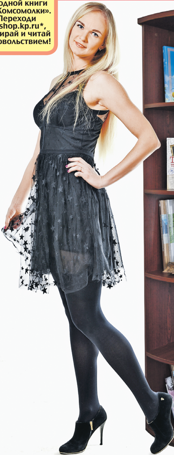
Алексей ФОКИН/«КР» - Тула