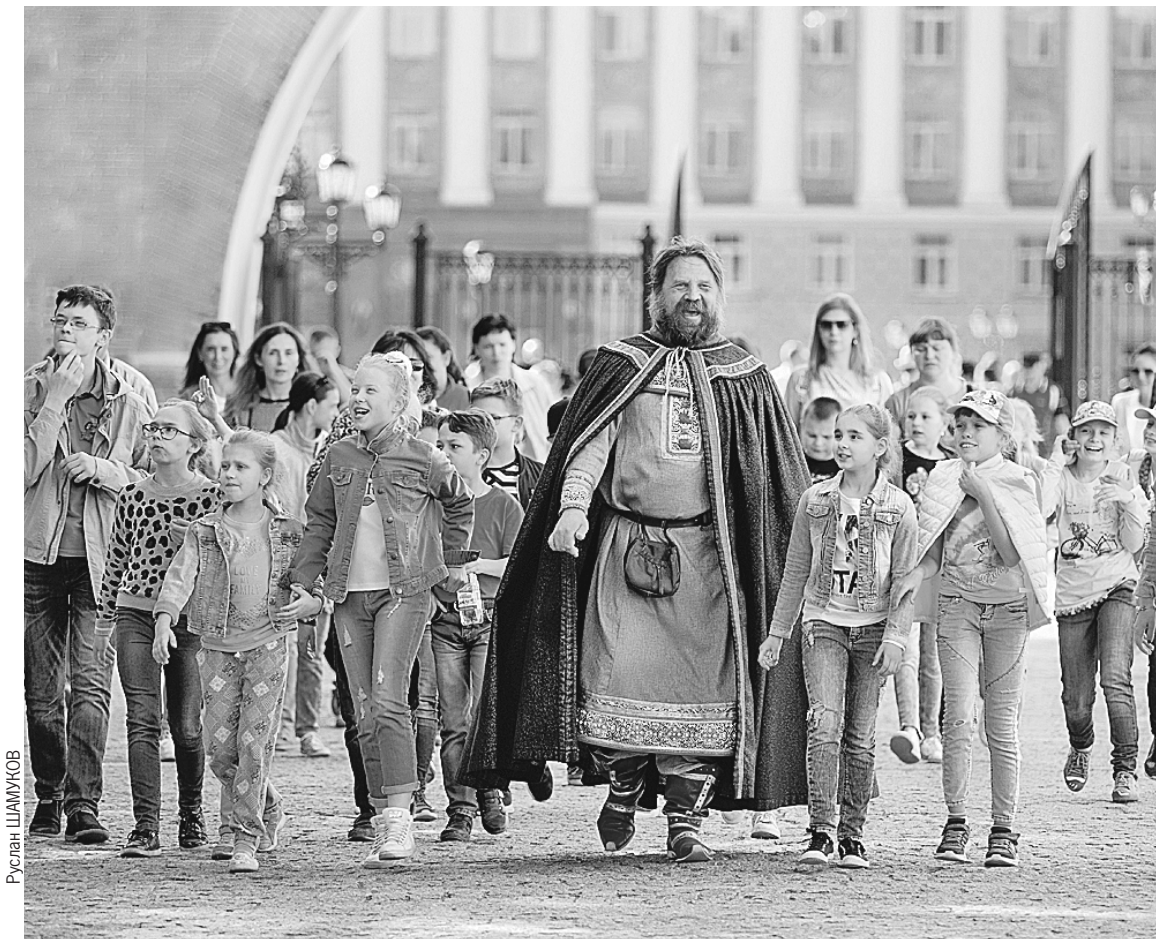
Российско-американская конференция прошла в городе, в котором гармонично сочетаются история и современность, сохраняются культурные традиции.

- Наши отношения переживают сейчас трудный период, мы не можем согласиться по многим вопросам. Тем не менее очевидно, что мы можем двигаться вперед с помощью диалога, работать в тех областях, где у нас есть общие интересы. Одно неизменно в российско-американских отношениях: культурные и образо-