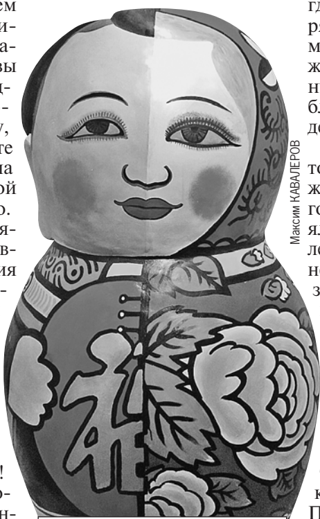
Даже матрешки на Дальнем Востоке двуликие - русско-китайские...