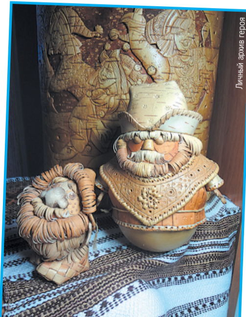
Работы сибирячки можно увидеть и на выставках в Иркутске.

«В своих работах мастер добивается тончайшей проработки деталей и выразительности рисунка в сюжетных композициях, отражающих человека, животный мир и природу Прибайкалья», - написала в своей рекомендации в Союз художников России председатель