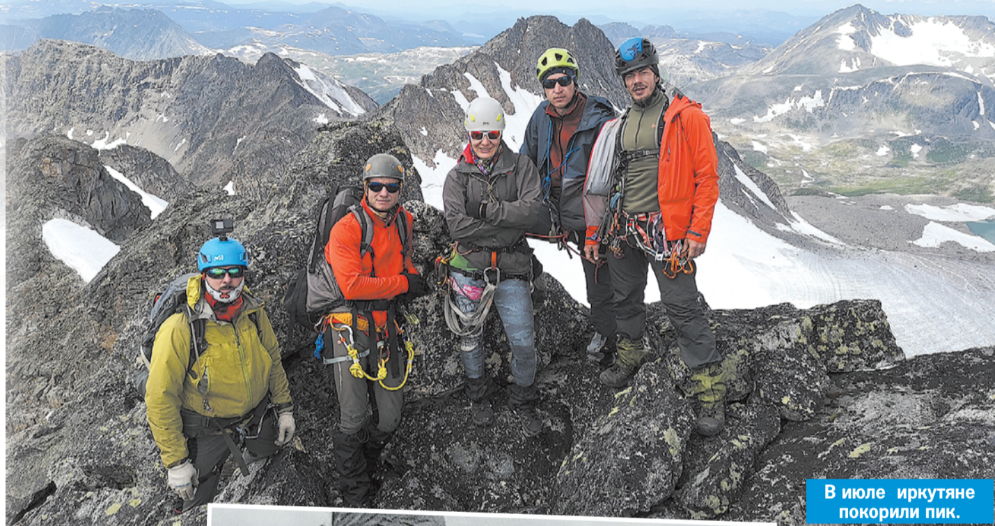
В июле иркутяне покорили пик.

- Расстроились ли, что заявка на призовое место в чемпионате прова-