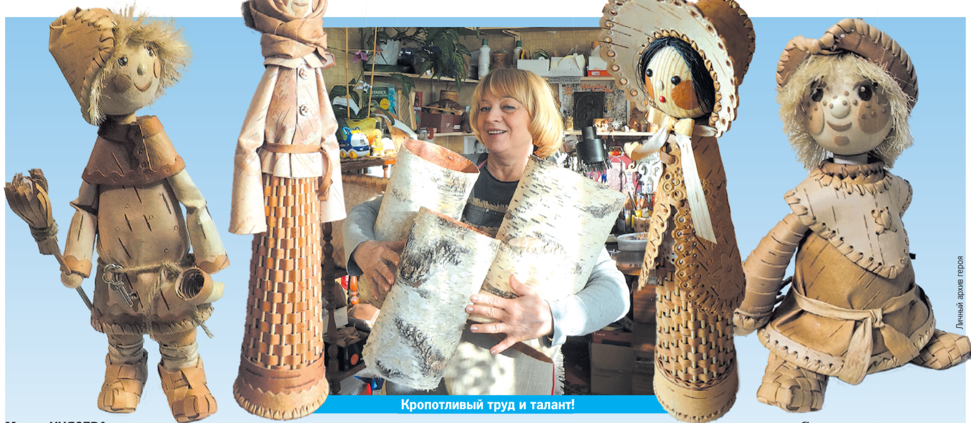
Кропотливый труд и талант!