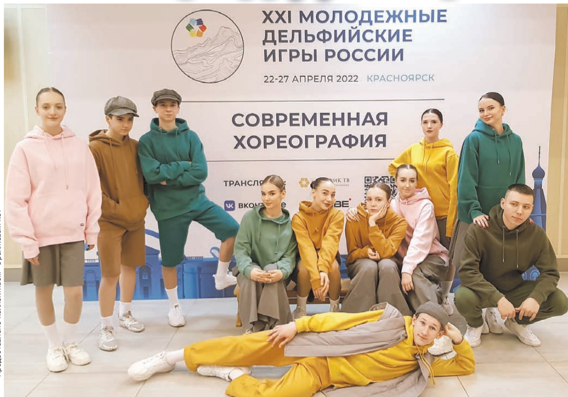
Предоставлено коллективом «Оранжевый кот»