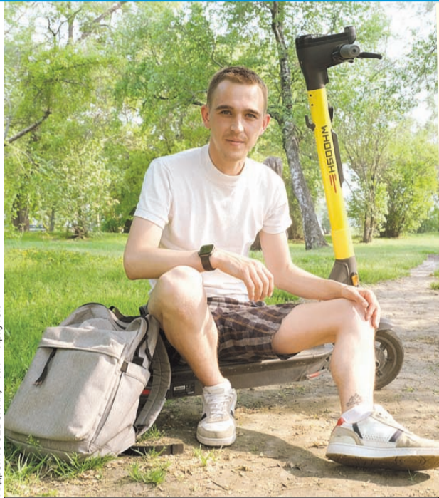
Пешеход или участник дорожного движения? Все-таки пешеход.