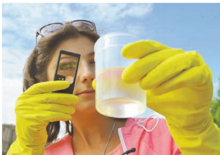
Евгения ГУСЕВА/«КТ» - Москва

А также в поселке Горького, вдоль улицы Старокузьминская, около объездной дороги Ново-Ленино и на других территориях.