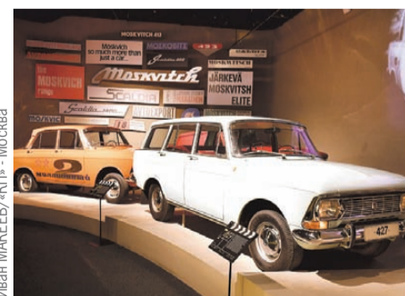
Иван МАКЕЕВ/«КТ» - Москва

Иркутяне в возрасте от 35 до 44 лет позитивно оценивают предложение чаще более молодых и более зрелых горожан (56%). Кстати, женщины одобряют идею приобретения машины на материнский капитал чуть чаще мужчин (54% и 47% соответственно).