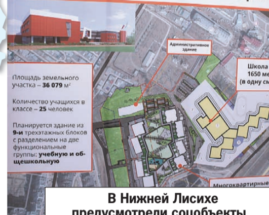
Схема функционально-планировочной организации

В Нижней Лисихе предусмотрели соцобъекты.