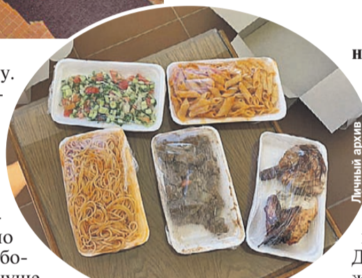
Сейчас они с женой в изоляции. Такие обеды им приносят.

- Корпус для ковидных больных заполнен полностью?