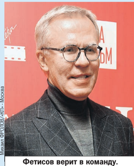
Фетисов верит в команду.

- Матч против США понравился, - говорит Вячеслав Фетисов . - Красивый хоккей, постоянное давление на соперника. Видно, что команда находится в хорошей физической форме. Превосходили американцев во всех компонентах игры. У соперника шансов не