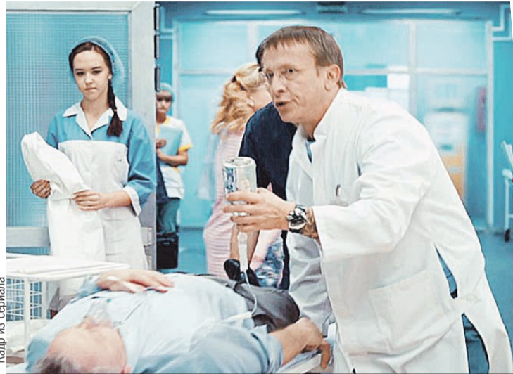
Зав. терапевтическим отделением в сериале «Интерны» Быков в исполнении Ивана Охлобыстина циничен, суров, но справедлив. Он может третировать подчиненных, но ради пациентов.

И тут возникает вопрос: а справедливо ли мы хотим видеть наших врачей подвижниками, служителями «клятвы Гиппократова», которые нам всегда и все должны, и не просто бесплатно, но и вежливо! Или мы постепенно приближаемся к «цивилизованному Западу», который так любимо при- водить в пример: «Уж там-