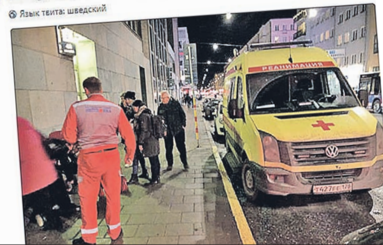
Когда питерскую бригаду «Скорой» по особому вызову послали в Стокгольм, наши медики, приняв своего пациента, не смогли проехать мимо упавшего шведа и оказали помощь на месте, вызвав изумление скандинавов...