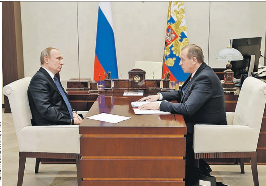
Губернатор Иркутской области Сергей Левченко попросил Владимира Путина помочь построить в столице региона ледовый стадион к чемпионату мира по хоккею с мячом. Президент пообещал сделать это.