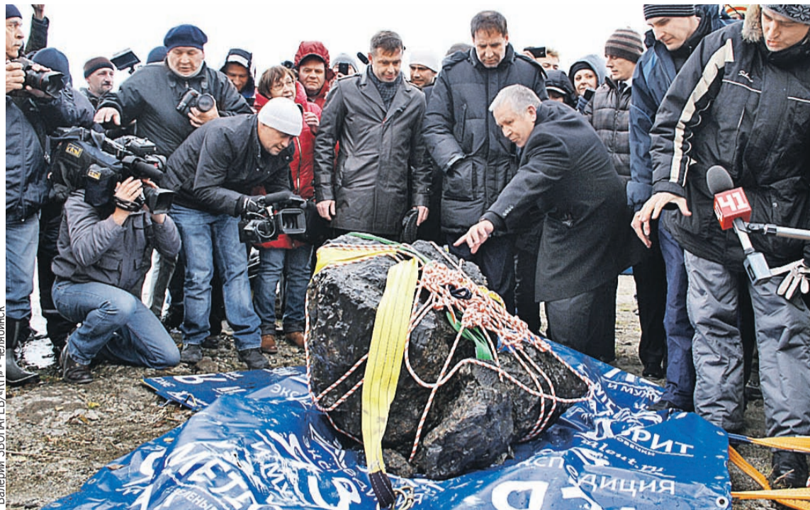
Это самый большой обломок челябинского метеорита - тот самый, который достали из озера Чебаркуль. А тонны более мелких рассыпались по тайге.