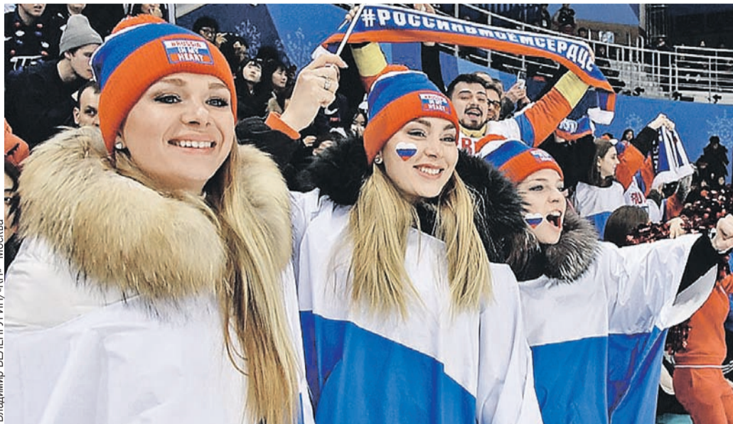
Российские болельщицы на олимпийской трибуне: красота спасет мир. И спорт...

Разумеется, когда 5 декабря Россию как государство отстранили от Олимпиады, расчет был именно на то, что в этой горячке нам не хватит времени на суды. И что мы ухватимся за самое глупое и постыдное,