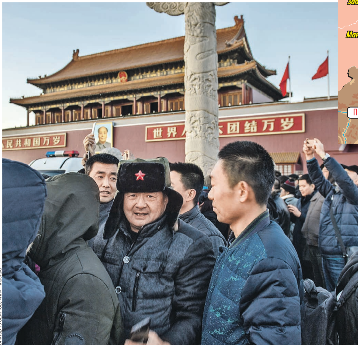
На главной площади Китая, где стоит и мавзолей Мао Цзэдуна, толпа народа, желающего ему поклониться, куда больше, чем очередь в Мавзолей Ленина в Москве.

Власти поняли, к чему это идет, и сейчас пытаются закрутить гайки, - продолжает эксперт. - Но, слава богу, китайцы, нахлебавшись капитализма, начинают уважать Мао Цзэдуна даже сильнее, чем в России Сталина. И эту тоску по сильной руке компартия отлично эксплуатирует. На предприятиях возрождается традиции хунвейбинов - «часы самокри-