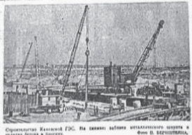
Строительство Каховской ГЭС. На снимке: работы по возведению плотины и здания ГЭС.

Двадцать лет назад на территории нынешней Каховской ГЭС началось строительство мощного гидроузла. В то время это было крупнейшее гидротехническое сооружение в СССР. Работы велись в сложных условиях. Строители преодолевали трудности, связанные с отсутствием инфраструктуры в районе строительства. Несмотря на это, работы шли быстро и качественно. Уже тогда были заложены основы будущей Каховки - города, который вырос вокруг гидроузла.