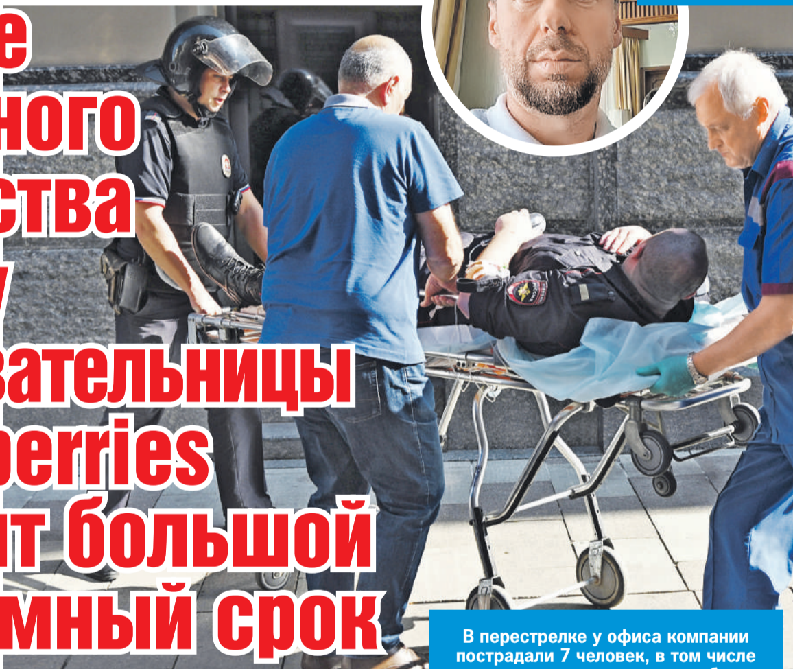
В перестрелке у офиса компании пострадали 7 человек, в том числе правоохранители, двое погибли.