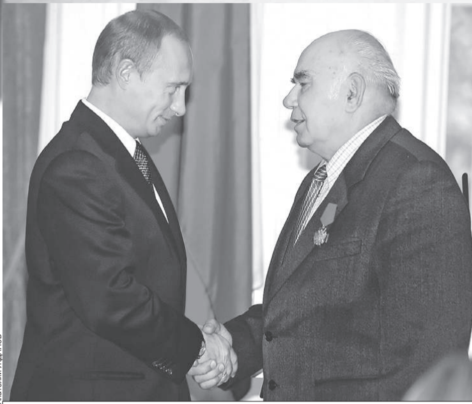
Владимир Путин награждает легендарного журналиста «Комсомолки» орденом «За заслуги перед Отечеством» IV степени.

память уроженца этих мест, знаменитого на весь мир журналиста «Комсомольской правды» - путешественника, писателя, защитника природы.