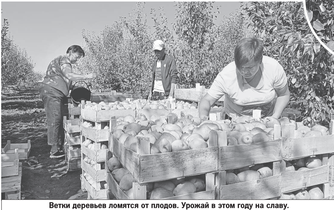
Ветки деревьев ломаются от плодов. Урожай в этом году на славу.

ки от паразитов. Главный враг - медяница. Она повреждает плод, поглощая сок из растений. Вызывает недоразвитие, листья желтеют и скручиваются, бутоны осыпаются. При Украине таких хороших препаратов для борьбы с паразитами у