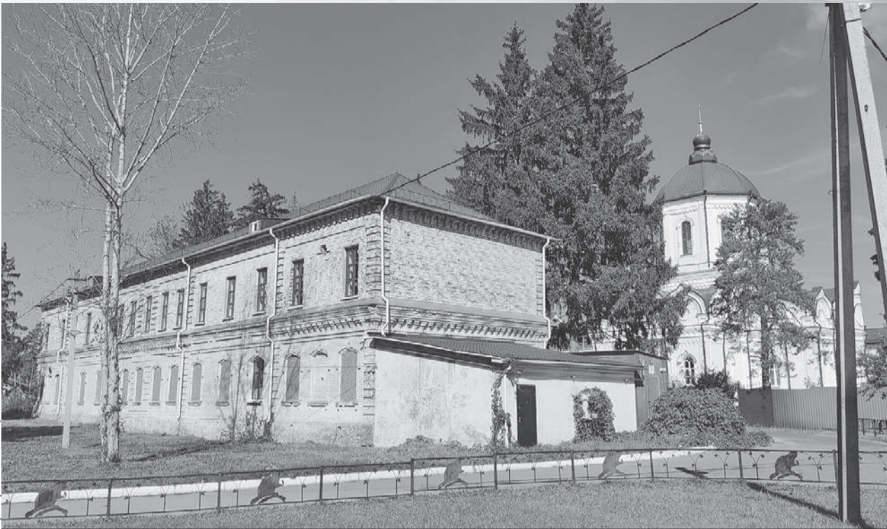
Тот самый дом в заповеднике имени Пескова, где на 2-м этаже пока еще живет музей.

Единственный памятник Пескову в Воронежском заповеднике. Хотя, по сути, Василию Михайловичу обязаны своим существованием все заповедники страны.