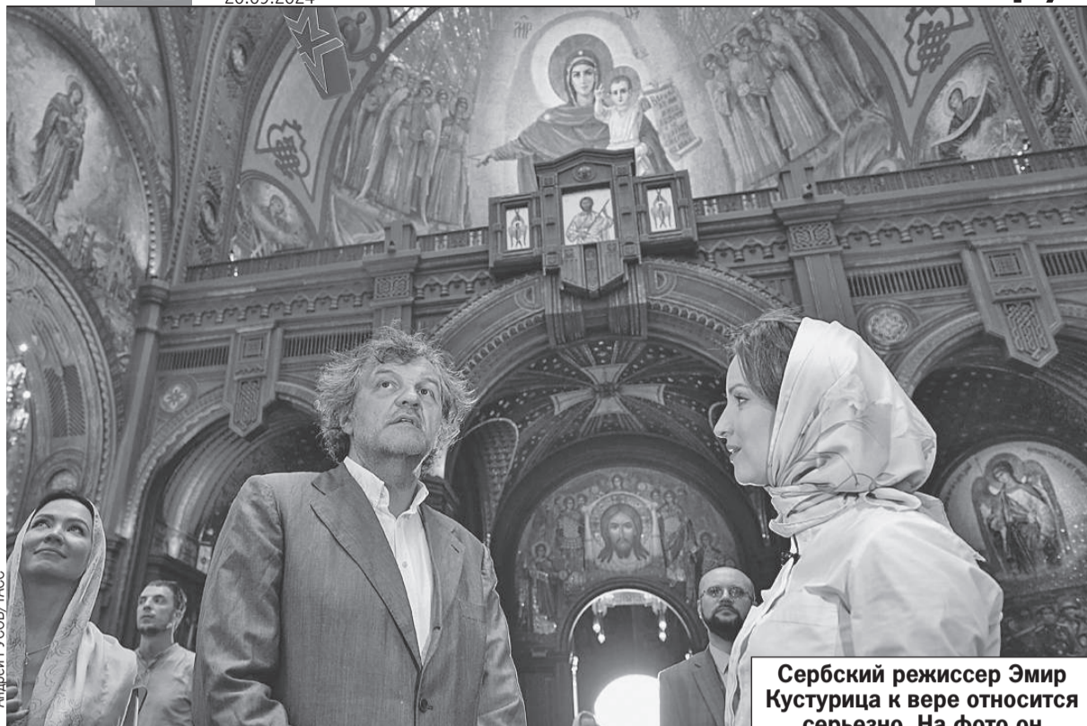
Сербский режиссер Эмир Кустурица к вере относится серьезно. На фото он в храме Вооруженных сил.

Но рассчитывать, что Россия поведется на этот шитый белыми нитками план, явно не стоит. Пусть «просроченный» даже не пробует.