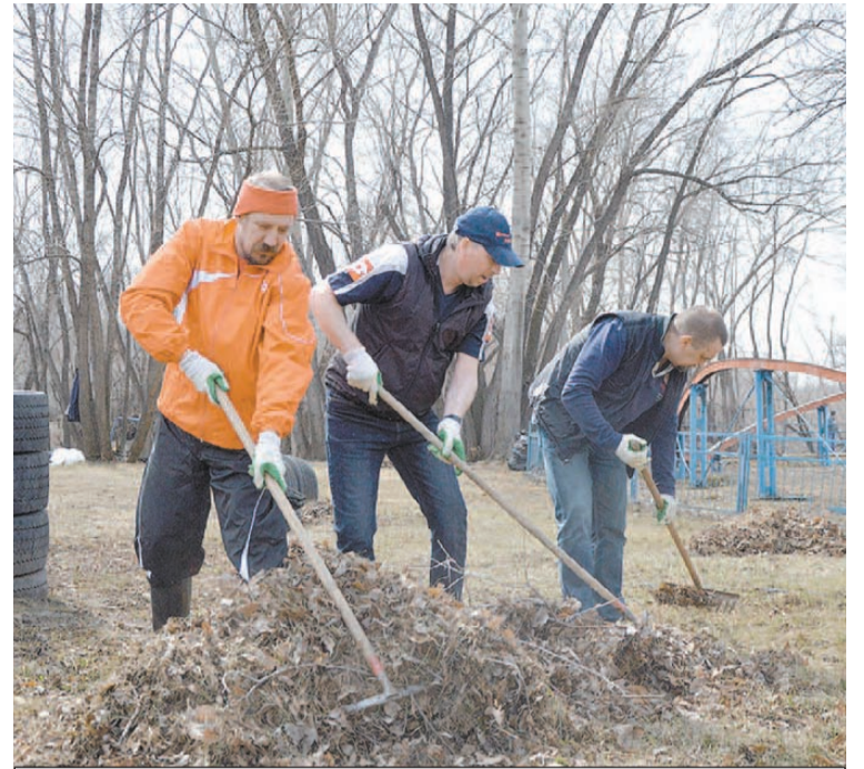
После уборки в парке начался концерт.

Берега Барнаулки, мимо которых мы плыли в двух рафтах, были похожи на бесконечную свалку. На деревьях болтались сотни желтых рваных пакетов, земля тоже