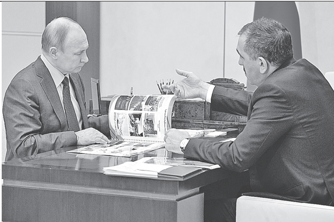
Юнус-Бек Евкуров пришел к президенту не с пустыми руками. Он принес фотоальбом построенных в Ингушетии школ, детсадов и перинатального центра.

- Весь общественный транспорт республики уже работает на газомоторном топливе, - сказал Евкуров. - Мы специально заказали на Нижегородском заводе переоборудование автобусов на газомоторное топли-