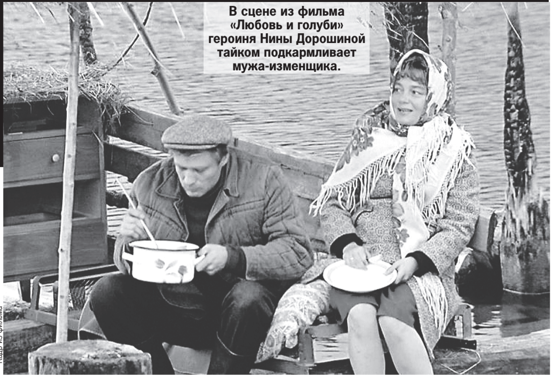
В сцене из фильма «Любовь и голуби» героиня Нины Дорошиной тайком подкармливает мужа-изменщика.

- У нее душа была добрейшая, ей хотелось всех осчастливить... Она любила театр, и там, на сцене, выражалось ее необыкновенное сердце, ее душа, ее обаяние. Ее любили люди, а завоевать любовь не так-то просто. Это уни-