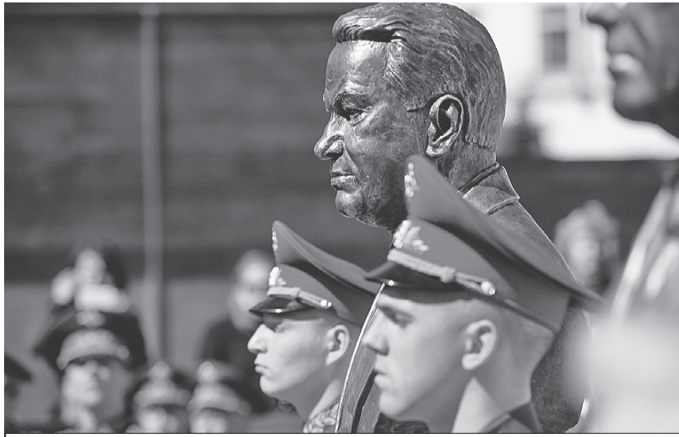
Бронзовый бюст Бориса Ельцина занял свое место по соседству с бюстом Михаила Горбачева. В жизни они были «политическими противниками», а в истории встали рядом.

вательная, а не политическая, это место не для полемики, а для размышлений.