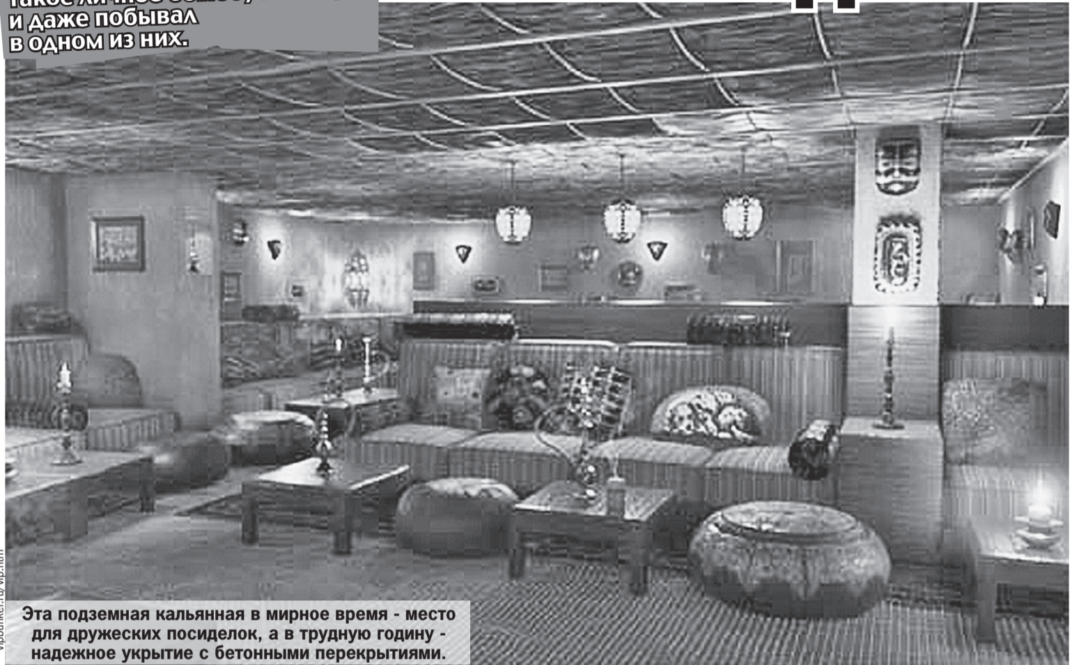
Эта подземная кальнянная в мирное время - место для дружеских посиделок, а в трудную годину - надежное укрытие с бетонными перекрытиями.

Спецкор «Комсомолки» попробовал заказать такое личное бомбоубежище и даже побывал в одном из них.