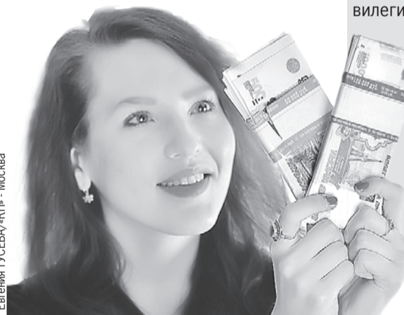
Аналитики советуют присмотреться к ценным бумагам банка.