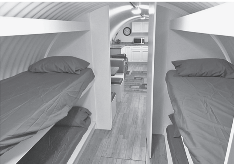
Этот вариант типа купе - бюджетный, сделанный в металлической трубе диаметром метра 3 - 4, вкопанной в землю на глубине метра-двух, с минимумом удобств.

атаки: ударную волну, облучение, радиоактивную пыль. А в мирное время мы поможем оформить его под кинозал, винный погреб, кальнянную, тренажерный зал или сейф.