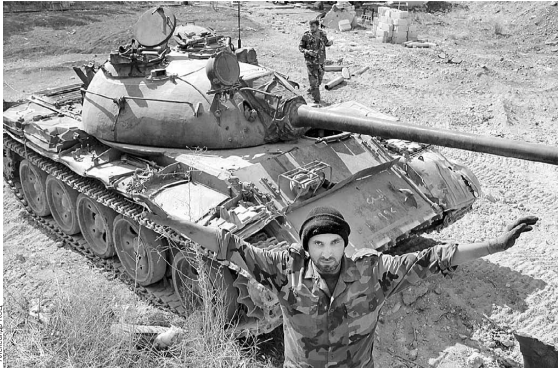
Танкисты правительственных сил ведут обстрел боевиков, метр за метром освобождая от них сирийскую землю.

До недавнего времени Ярмук между собой делили разные группировки, среди которых - и недобитки из ИГИЛ. Когда был решен вопрос с Восточной Гутой, боевики на юге столицы прекрасно понимали, что теперь примутся и за них. Большинство вняло аргументам российских переговорщиков и предпочло выехать на «зеленом экспрессе» в сторону Идлиба. Игилловцам же выезжать фактически некуда - желающих принять к себе этих отморожков нет даже среди таких террористических группировок, как «Джейш аль-Ислам» или «Фронт ан-Нусра». Поэтому упираться они будут до конца. Но на моих глазах сирий-