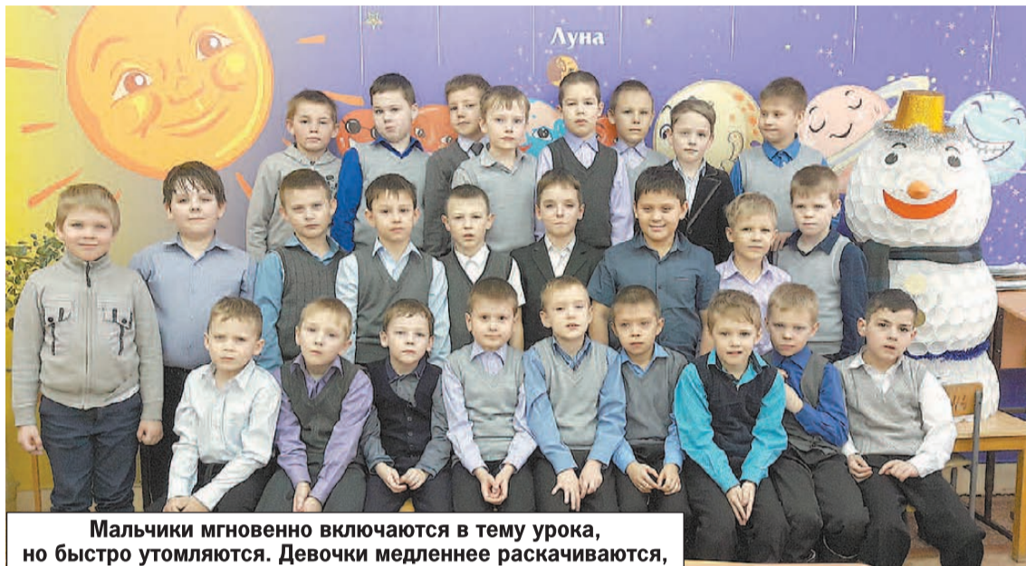
Мальчики мгновенно включаются в тему урока, но быстро утомляются. Девочки медленнее раскачиваются, зато потом их не уймешь.