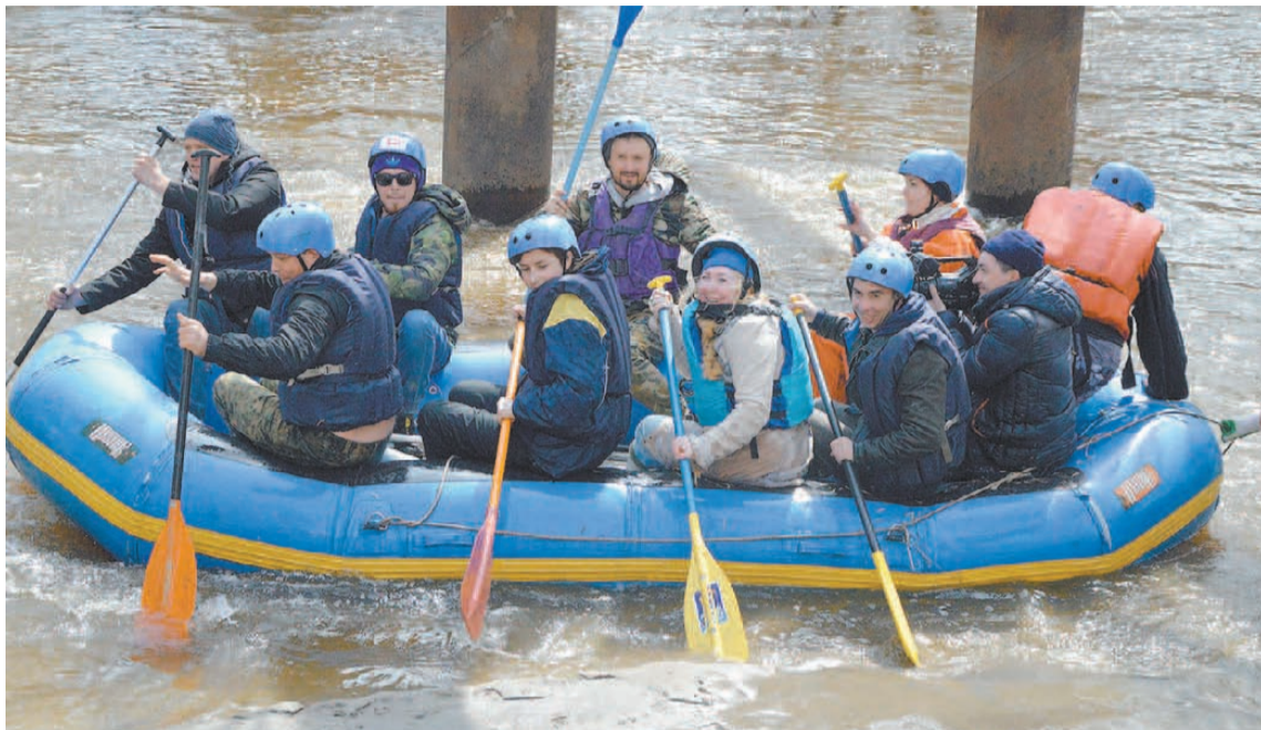
Берега Барнаулки, мимо которых мы плыли на двух рафтах, были похожи на бесконечную свалку.