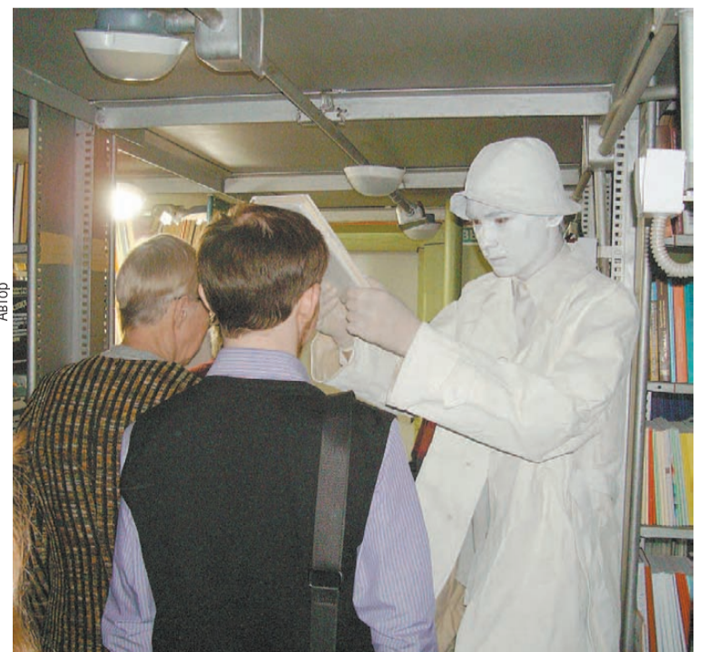
Призрак Горного Инженера посвятил своих гостей во всемирный орден читателей.

Гости библиотеки признавались, что никогда здесь не было так громко и весело, и при этом никто не ругался, а даже наоборот. В Шишковку приходили и большими компаниями, и с детьми, особо мило выглядели парочки пенсионеров, для которых это был лишний повод выйти из дома и немного развеяться.