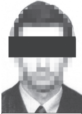
Вот он, агент-убийца Гордон. Говорите, ничего не видно? А вот британцам сразу все ясно стало.

Тот якобы действовал с пятью подопечными и вернулся в Россию.