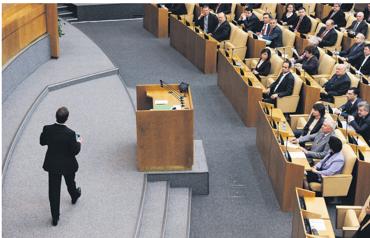
Премьер-министр Дмитрий Медведев может уведомить действующих депутатов Госдумы, что их бюджетными услугами правительство не воспользуется

Формально отчет Дмитрия Медведева перед Госдумой должен быть посвящен итогам 2015 года — во всяком случае, именно это имелось в виду в момент введения института доклада парламента правительству. Тем не менее, по данным «Ъ», значительная часть вопросов Белому дому, переданная из парламента, была посвящена различным вопросам антикризисного плана на 2016 год. В Белом доме на прошлой неделе состоялись несколько совещаний вице-премьерского и премьерского уровня, на которых обсуждался подготовленный Минфином проект документа об исполнении антикризисного плана, но они не были утверждены. У ведомства Антона Силуанова пока слишком много разногласий с коллегами по правительству о том, что делать с бюджетной конструкцией в ближайшее время, — жесткие предложения Минфина по сокращению госрасходов критикуются, тогда как видимой альтернативы им не представлено.