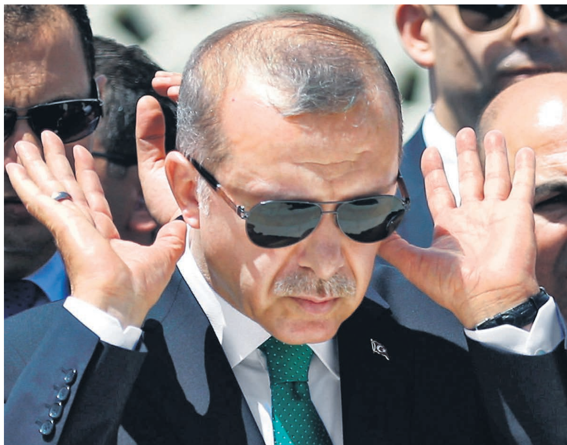
Президенту Турции Реджепу Тайипу Эрдогану потребовалось семь месяцев на то, чтобы прислушаться к требованиям Москвы и извиниться за инцидент с российским Су-24

В российско-турецких отношениях произошло событие, которого Москва ждала с 24 ноября 2015 года, когда в небе над Сирией был сбит бомбардировщик Су-24. Президент Турции Реджеп Тайип Эрдоган направил Владимиру Путину письмо, в котором извинился за гибель пилота Олега Пешкова. В Кремле неоднократно давали понять, что именно извинения, а также компенсация (за уничтоженный самолет и семье летчика) — обязательное условие восстановления диалога с Анкарой. До последнего времени господин Эрдоган упорно отказывался от извинений, но теперь неожиданно изменил свой подход. Учитывая то, что первый шаг к примирению фактически был сделан на условиях Москвы, опрошенные «Ъ» эксперты считают, что главный раздражитель в двусторонних отношениях снят и их восстановление может начаться уже в ближайшее время. На этой неделе в Сочи ждут главу МИД Турции Мевлуту Чавушоглу. Улучшение отношений России и Турции потенциально способно серьезно изменить ситуацию как минимум на трех крупных рынках обеих стран. Но даже при наиболее благоприятном развитии событий на прежний уровень они вернуться нескоро.