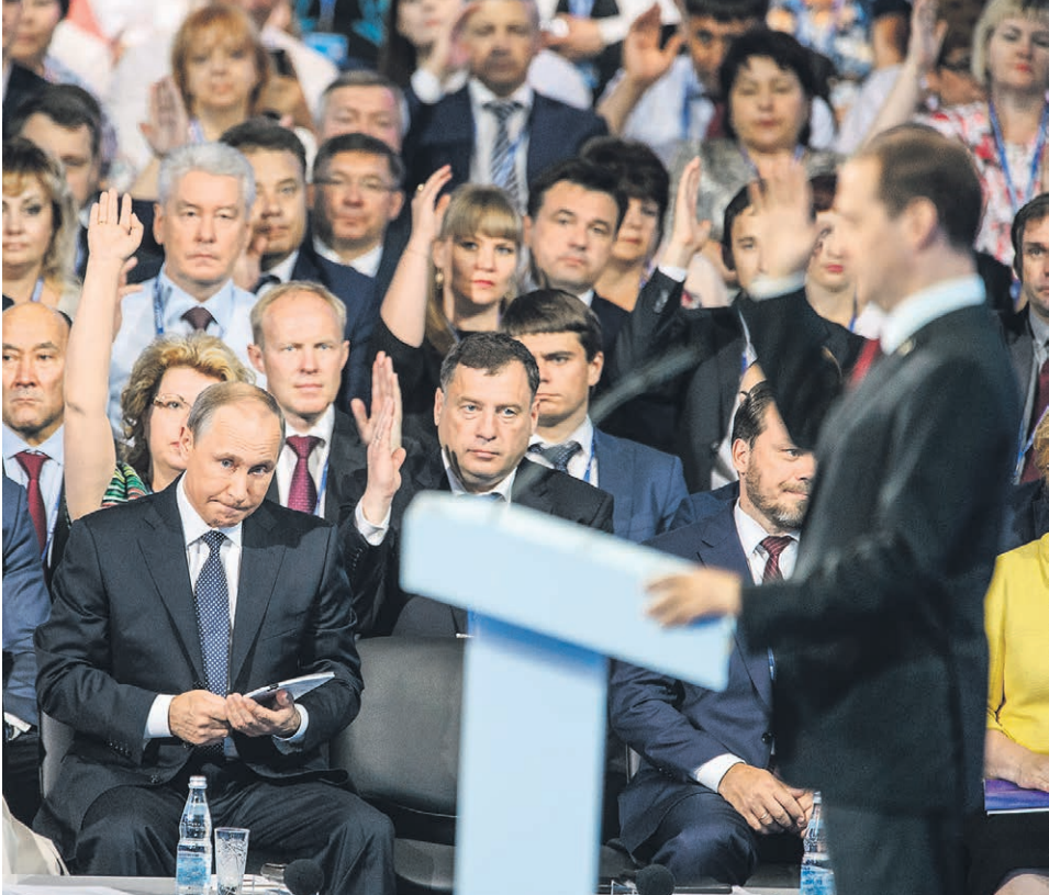
Владимир Путин — единственный, кто воздерживался от голосования за...