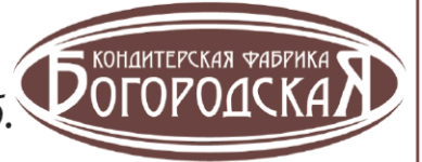
График работы 5/2, з/п 70 000 руб.