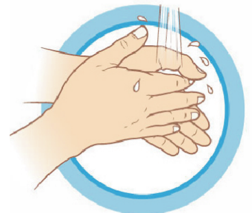
ЧАСТО МОЙТЕ РУКИ С МЫЛОМ