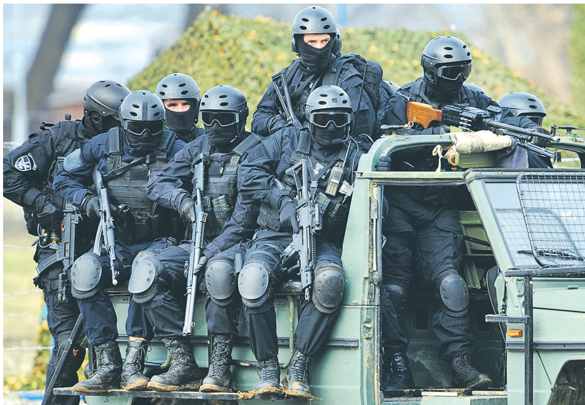
Белград считает, что цель рейдов в Косово — запугать местных сербов, и заявляет, что военные силы страны готовы «защитить людей в самые короткие сроки» в случае возникновения угрозы их безопасности