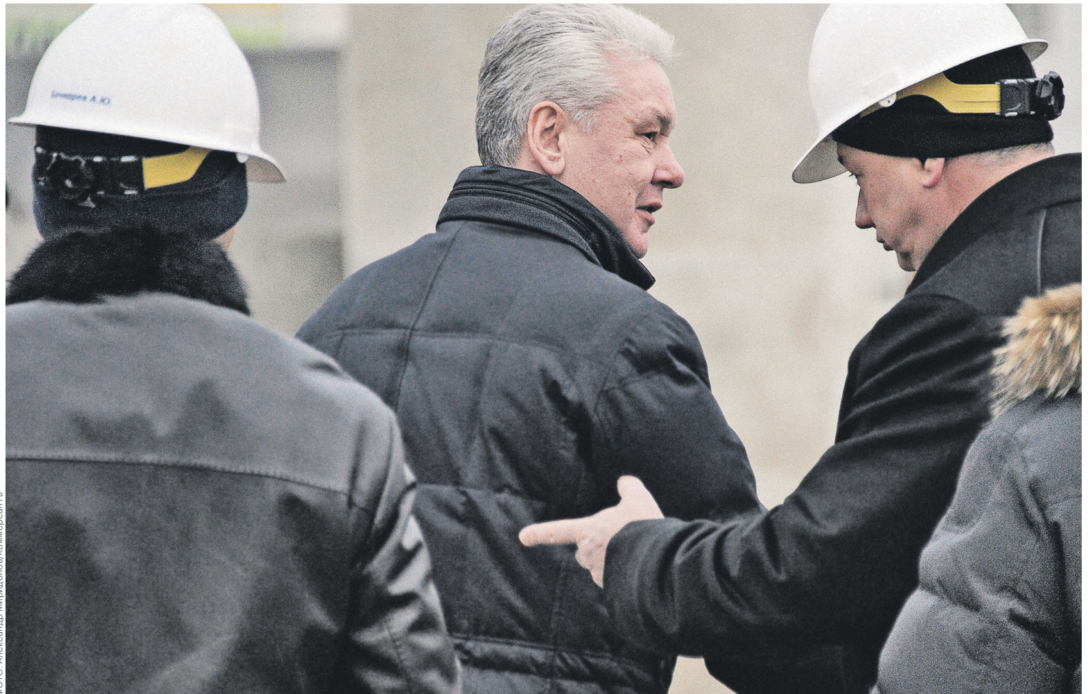
Согласно трехлетнему бюджету города, ежегодно на программу реновации будет направляться 100 млрд руб. На фото: мэр Москвы Сергей Собянин (в центре) и глава столичного Стройкомплекса Марат Хуснуллин (справа)

Далее по объему выигранных тендеров идут структуры группы компаний ПИК. ООО «МФС-ПИК» получило тендеры на общую сумму 662,2 млн руб., ООО «ПИК-Проект» — на 635,2 млн руб. Согласно базе данных СПАРК, «ПИК-Проект» напрямую принадлежит группе компаний ПИК; МФС-ПИК — зарегистрированной на Кипре «Эсэзионе капитал лтд», которая, как в пресс-службе ПИК подтвердили РБК, является одной из структур группы. РБК в марте прошлого года сообщал, что именно ПИК может стать основным застройщиком по программе реновации.