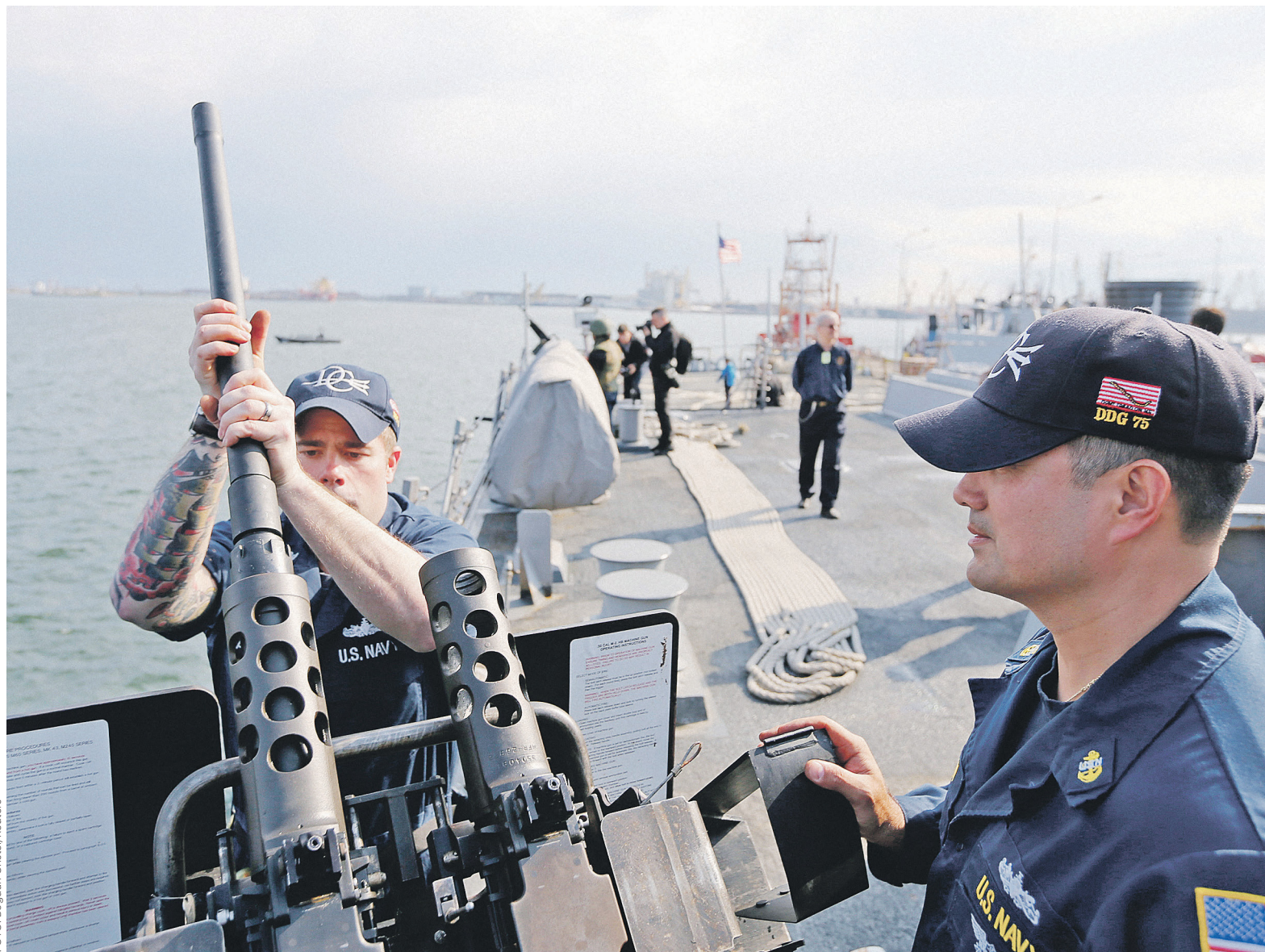
По мнению американского аналитического портала, вероятнее всего, США атакуют объекты, связанные с сирийской химической программой, — в частности, авиабазы Думаир, Мардж Рухаил и Меззе. Ракеты могут быть запущены с эсминца Donald Cook (на фото)

Российские официальные лица предложения Трампа встретили скептически. Кремль «не участву-