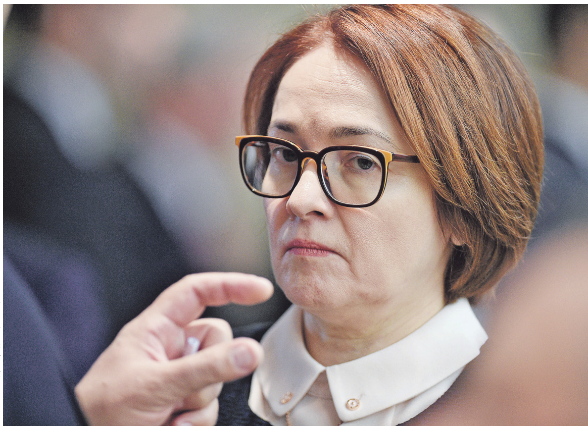
ЦБ допустил, что в случае необходимости может вернуться к практике предоставления валюты через механизм РЕПО и валютных интервенций. На фото: глава ЦБ Эльвира Набиуллина

ЦБ еще во вторник дал понять, что пока рисков для финансовой стабильности не видит и не будет прибегать к «системному вмешательству». Воздействие регулятора на рынок пока ограничивается словесными интервенциями и прекращением покупок валюты для Минфина в рамках бюджетно-