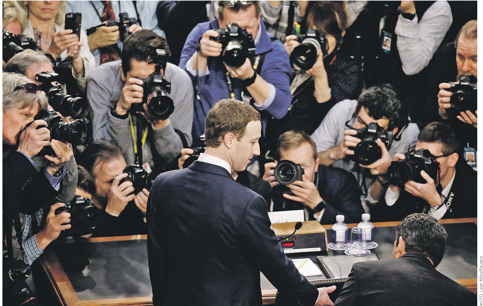
Выступая на слушаниях в сенате США, основатель соцсети Facebook Марк Цукерберг извинился за утечку данных и объяснил происходящее «гонкой вооружений» с Россией в интернете

На слушаниях сенаторы обсудили с Цукербергом, какие изменения в законодательство следует внести, чтобы снизить вероятность неправомерного использования пользовательских данных в будущем. Сенатор Эд Марки предложил ограничить использование персональных данных детей младше 16 лет без разрешения родителей или самих детей. Сенатор Джо Бартон — запретить распространение личной информации детей до 18 лет, использующих Facebook, чтобы защитить их персональные данные. Однако Цукерберг отметил, что не уверен, что такой закон необходим в США, пока не станут ясны его детали. «Реальность такова, что подростки часто сами хотят делиться своим мнением пуб-