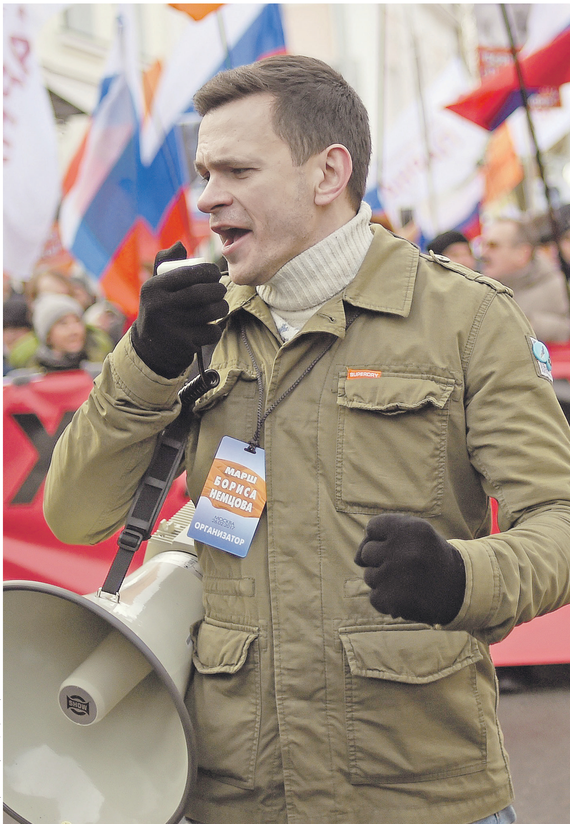
Илья Яшин выразил надежду, что он станет единым кандидатом от демократической оппозиции, победив на праймериз

О намерении участвовать в выборах сообщили бывший депутат Госдумы от «Справедливой Рос-