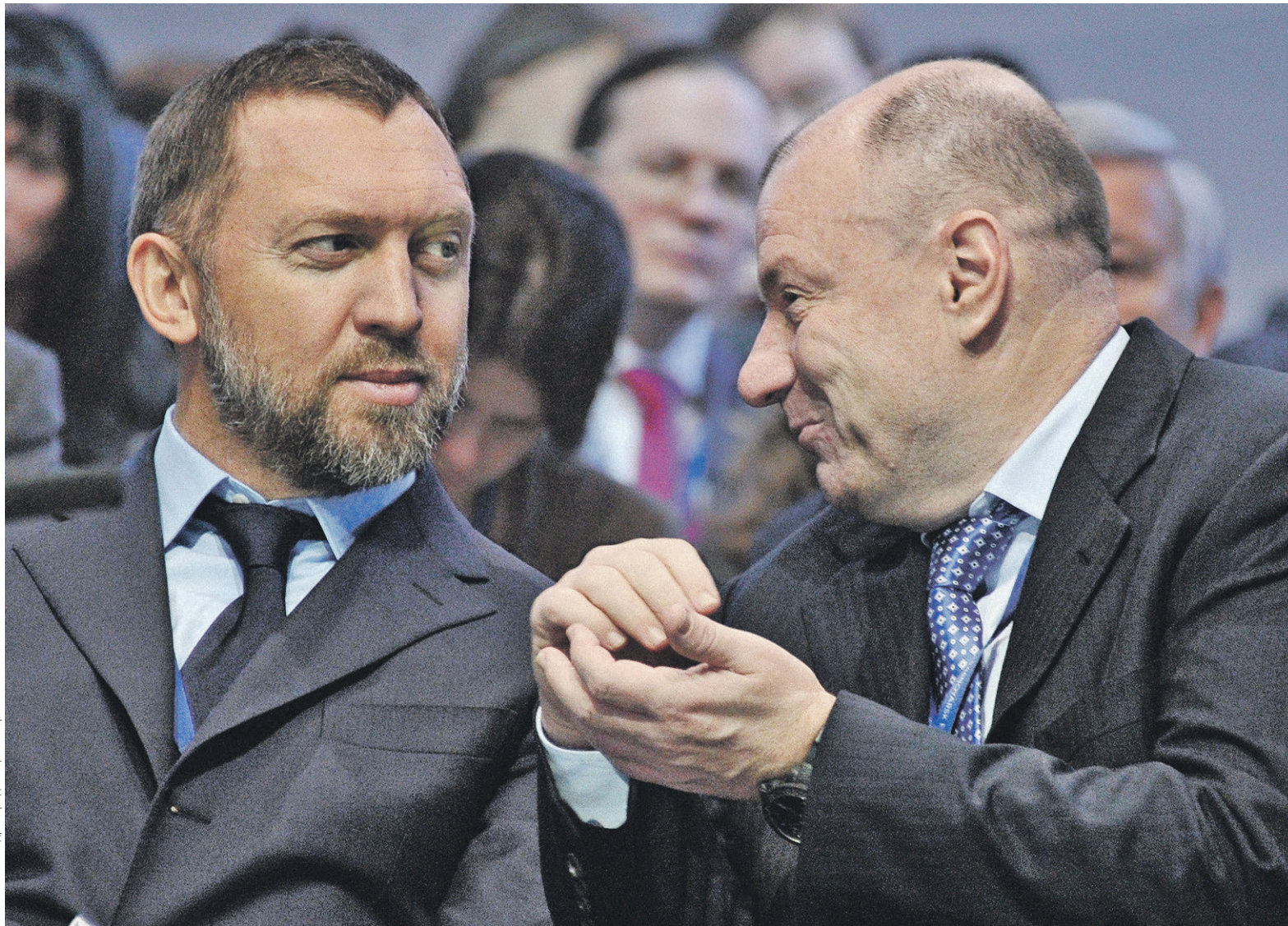
Дивиденды от «Норникеля» могут оказать существенную помощь попавшему под санкции Rusal Олегу Дерипаски (на фото с совладельцем «Норникеля» Владимиром Потаниным)