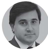
Никита Стасишин Минстрой РФ