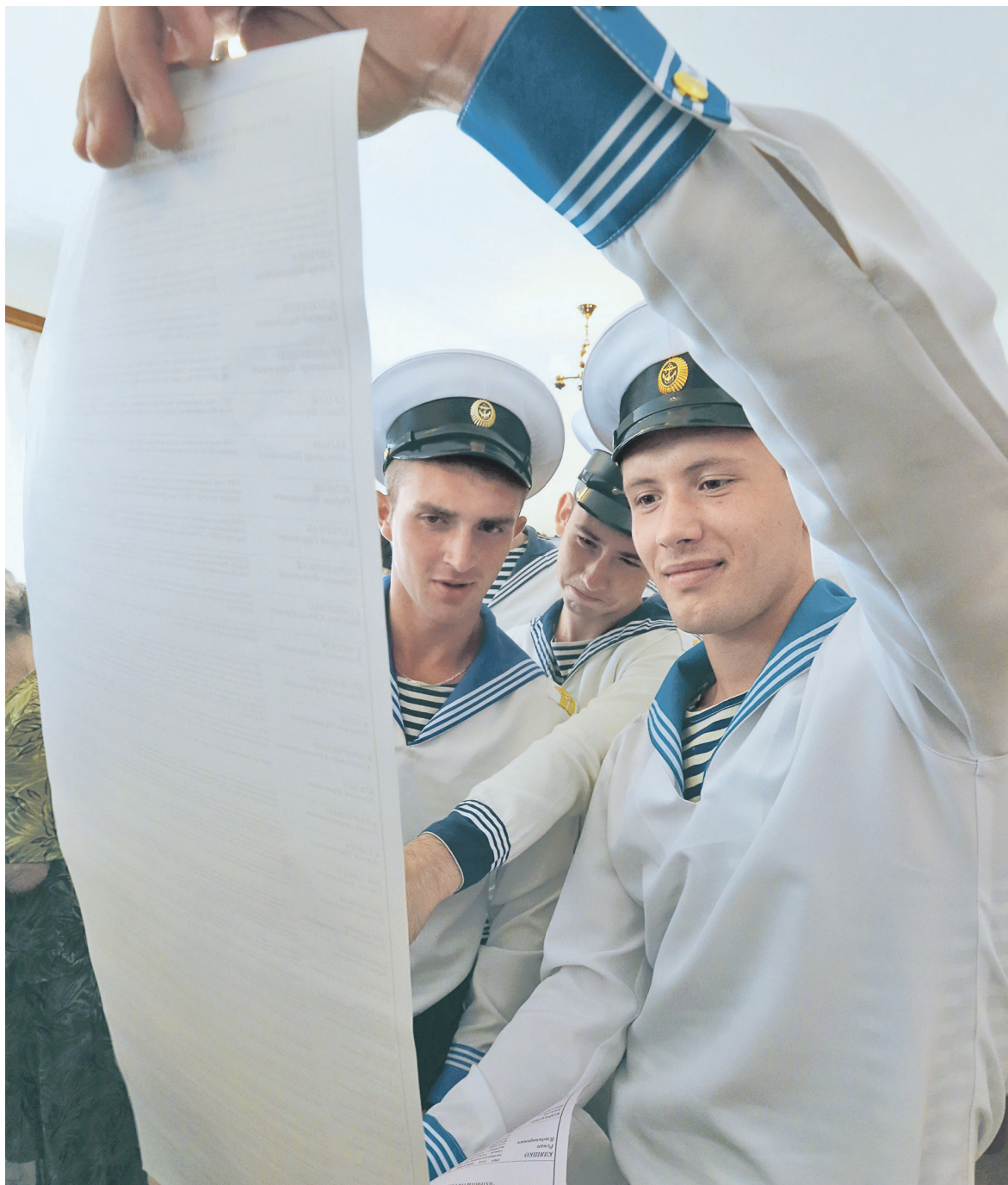
Выборы глав регионов пройдут по модели «минимизации конкуренции за счет элитных договоренностей», считает эксперт

На прошлой неделе новосибирский мэр-коммунист Анатолий Локоть договорился с главой области Андреем Травниковым о сотрудничестве и сохранении пря-