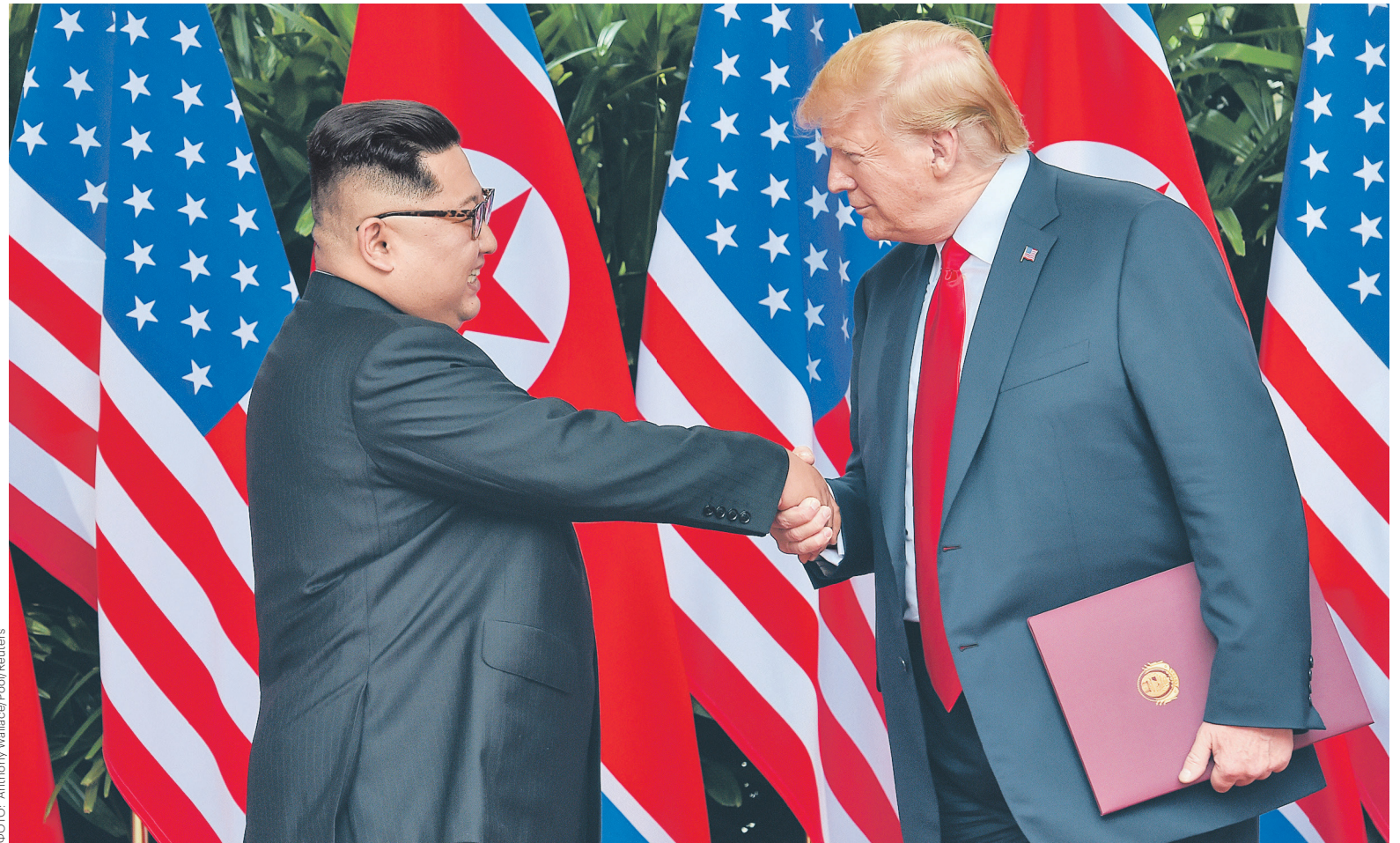
Лидерам США Дональду Трампу (справа) и КНДР Ким Чен Ыну удалось договориться по основной теме встречи — денуклеаризации Корейского полуострова

Стоит отметить, что исторический саммит едва не был сорван. 29 мая Трамп заявил, что встречи не будет из-за «враждебных» заявлений МИД КНДР, которое незадолго до этого резко раскритико-