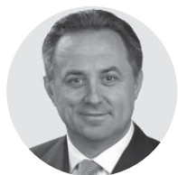
Виталий Мутко Правительство РФ