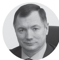
Марат Хуснуллин Правительство Москвы