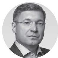
Владимир Якушев Минстрой РФ