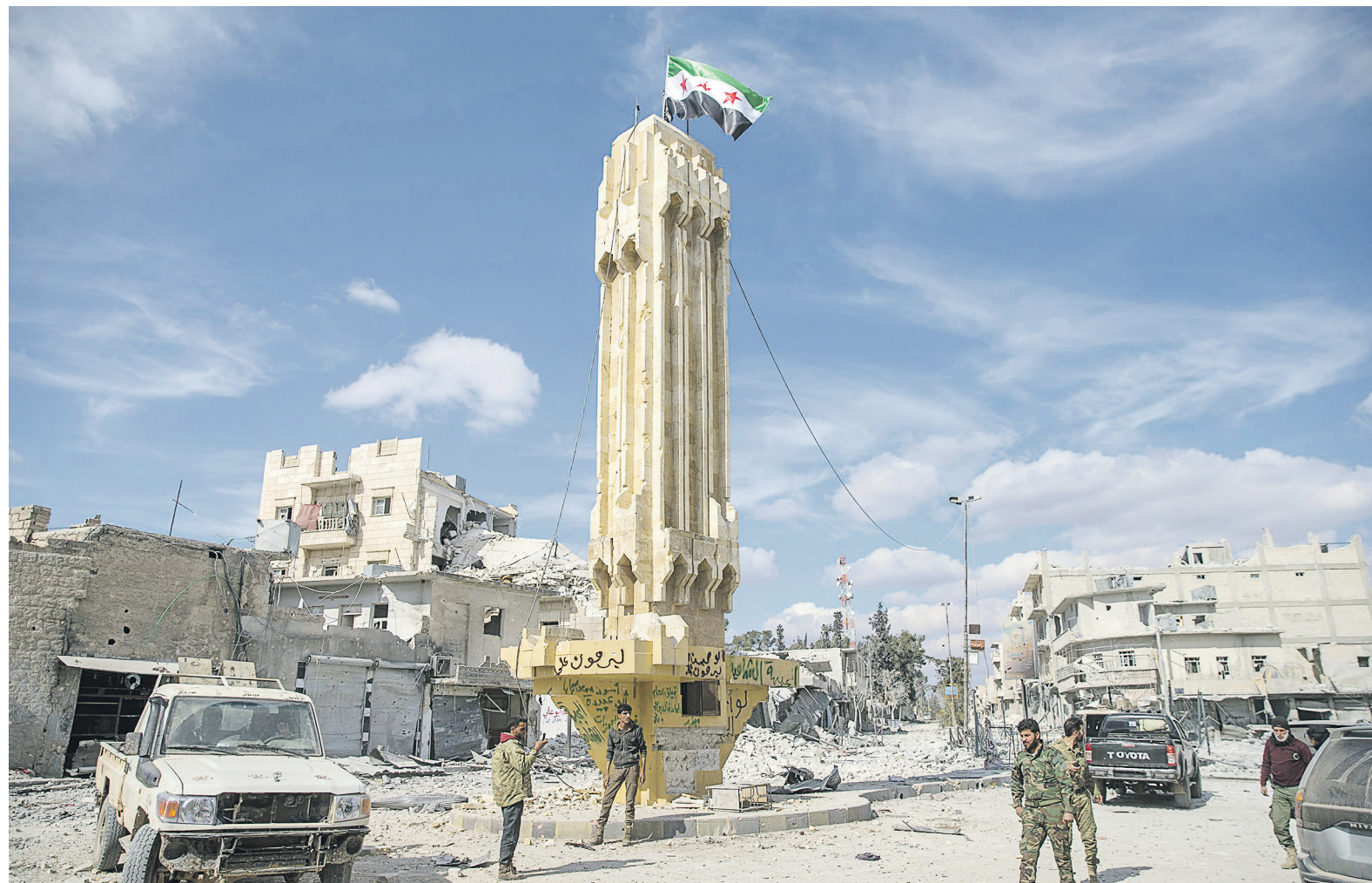
Бойцы «Свободной сирийской армии» — союзника Турции по операции «Щит Евфрата» — в освобожденном от ИГИЛ городе Эль-Баб

уверяла, что следующие цели операции — это «столица» ИГИЛ Ракка и контролируемый курдами Манбидж. 13 февраля об этом заявил Эрдоган. Однако падение Эль-Баба две недели спустя совпало по времени с наступлением правитель-