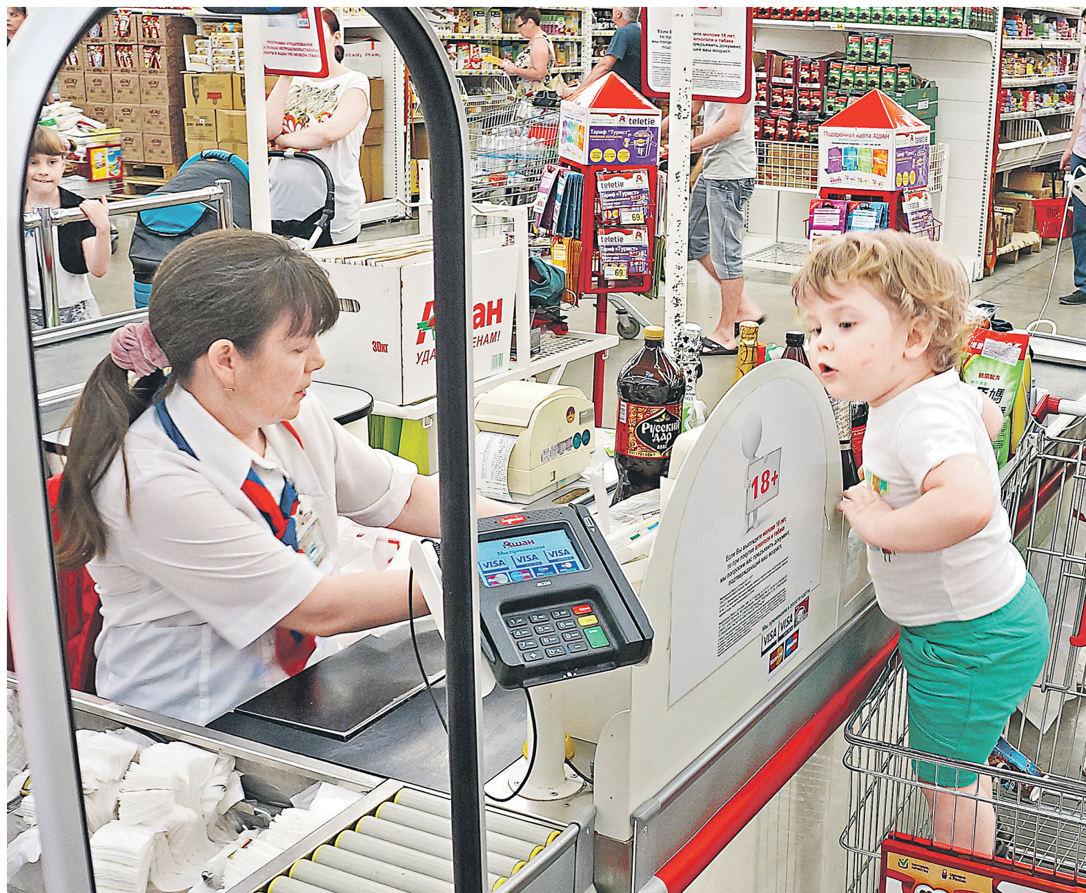
Сейчас по новым правилам работает чуть более 600 тыс. касс, или примерно половина из действующих, подсчитали в АКИТ. Оплаченных, но еще не поставленных касс, — около 200–300 тыс.