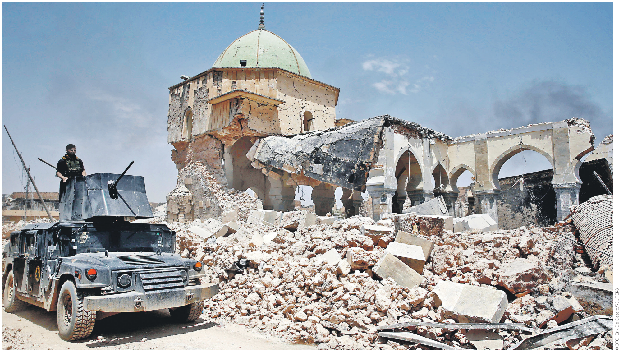
Три года назад в мечети ан-Нури в Мосуле ИГ была объявлена халифатом. В конце прошлой недели иракские правительственные силы отбили руины этой соборной мечети