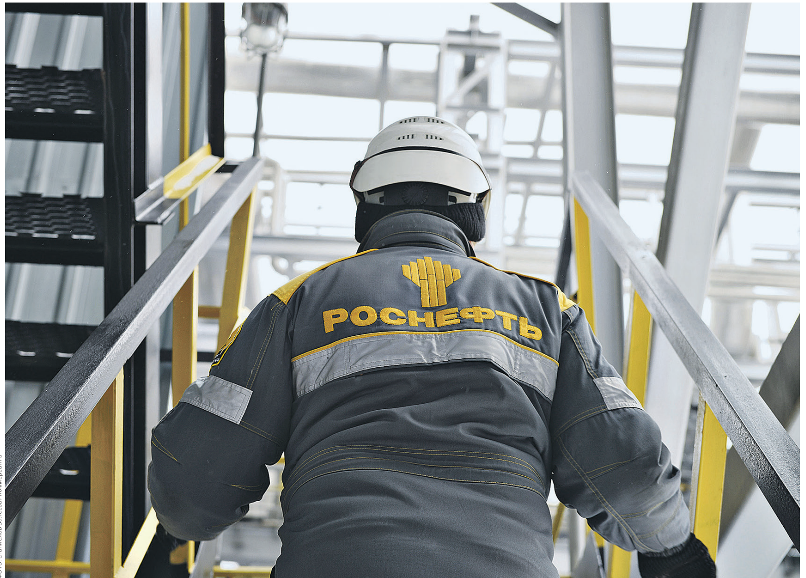
В этом году «Роснефть» может выплатить премии сотрудникам позже обычного

Представитель «Роснефти» Михаил Леонтьев сказал РБК, что он является врагом профсоюзного движения и не отвеча-