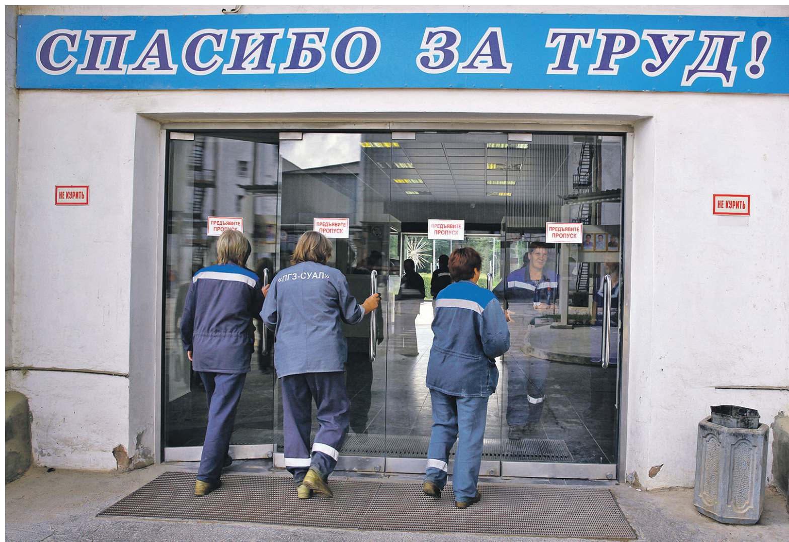
На 1 Мая безработица в моногородах достигла 139,3 тыс. человек

Объем производства в реальном выражении (с поправкой на рост цен) на предприятиях в моногородах за 2015 год снизился на 4,8% (это хуже показателя по промышленности в целом, где было падение на 3,4%). Объем запасов за прошлый год увеличился на 10% к уровню 2014 года, но уже за первые два месяца года по сравнению с уровнем конца 2015-го упал вдвое. «Многие предприятия не спешат существенно наращивать объемы производства ввиду прежде всего слабого внутреннего спроса», — говорится в отчете. Анализ ситуации на 15 предприятиях, которые показали «наименьший рост» объема выручки по состоянию на 24 февраля (в их числе — «Алданзолото ГРК» в Якутии, «Блок № 2 шахта Анжерска-