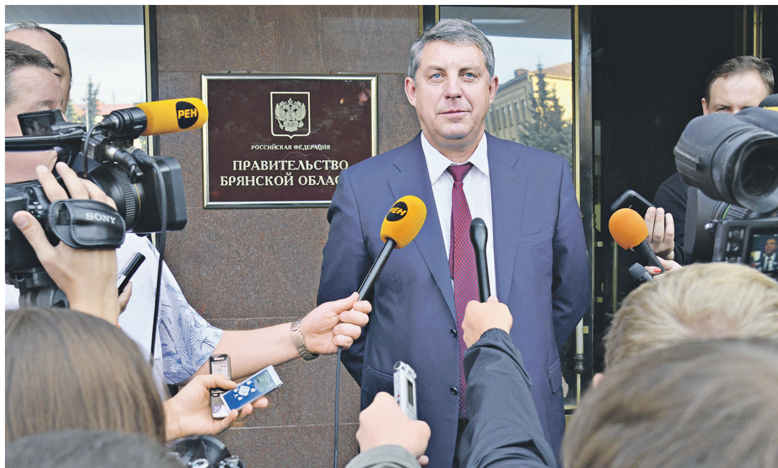
Экс-депутат Госдумы и выходец из ОНФ Александр Богомаз был назначен врио губернатора Брянской области в сентябре 2014 года

В собственности у супруги губернатора, как следует из декларации, находятся 79 земельных участков. Большинство из них — это участки сельскохозяйственного назначения. Площадь самого большого из этих участков составляет 7,6 млн кв. м. Богомаз также указала в декларации квартиру площадью 34,4 кв. м, а также шесть складов, мельницу, пять свинарников и два коровника, пилораму, здание бойни, несколько овощехранилищ и ангаров, три