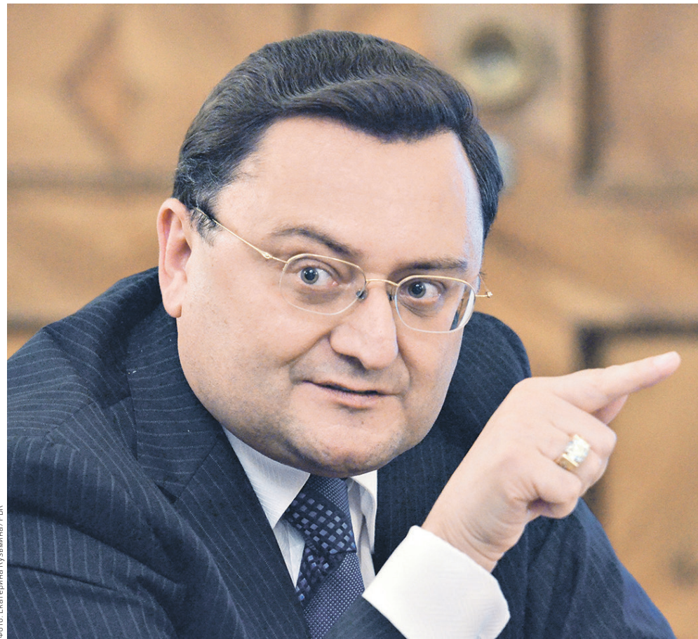
↑ Владельца аэропорта Домодедово Дмитрия Каменщика задержали и поместили под домашний арест в феврале 2016 года по делу о теракте 2011 года в Домодедово. 17 мая было объявлено о подписании договора о компенсациях между аэропортом и потерпевшими по делу о теракте. После поступления денег потерпевшие намерены обратиться к суду с просьбой освободить Каменщика