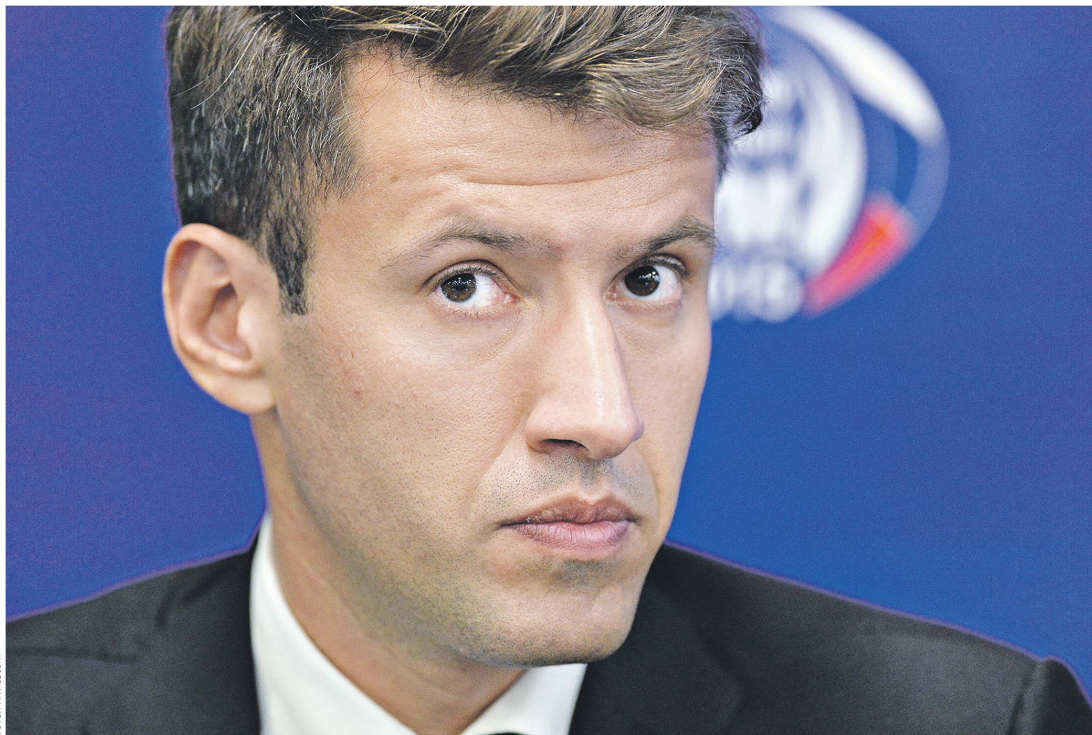
Риски по ипотечной ценной бумаге возьмет на себя АИЖК (на фото — глава агентства Александр Плутник)

Идея с выпуском ипотечных ценных бумаг появилась по итогам обсуждения Минфином, ЦБ