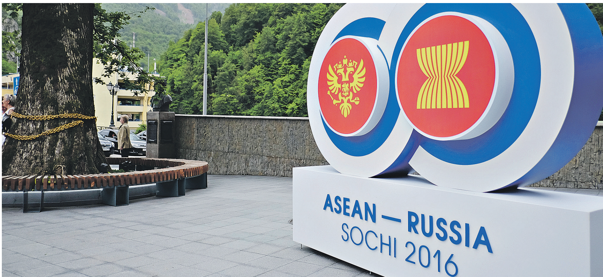
В 2014 году во внешней торговле АСЕАН на Россию пришлось менее 1% всего объема, АСЕАН в российской торговле занимает 2,7%. Эксперты считают, что улучшить эти показатели будет непросто

ПАРТНЕРЫ Владимир Путин встретится с главами десяти азиатских стран