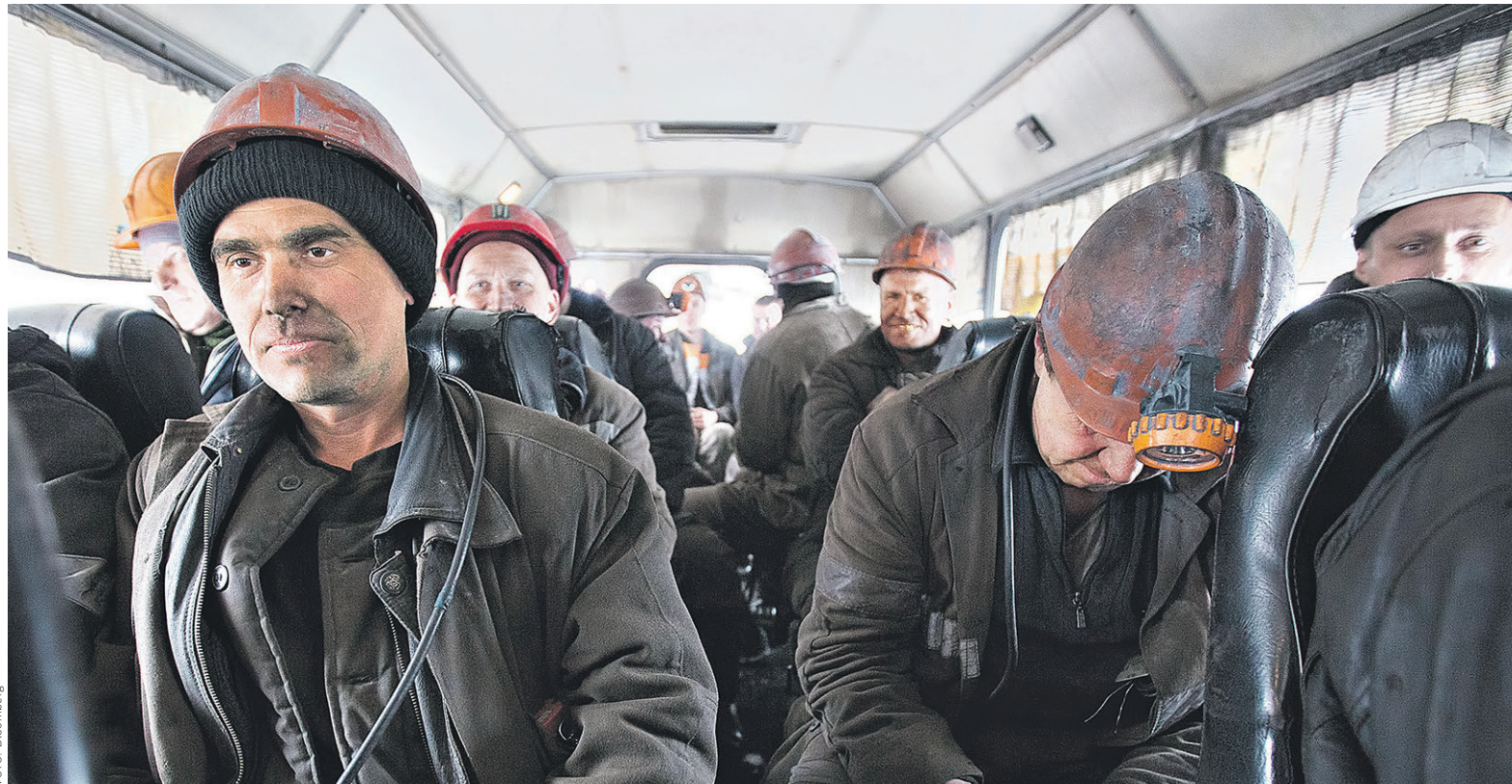
За последние три месяца только официальных безработных в моногородах стало на 10 тыс. больше. Еще 16 тыс. будут уволены в ближайшее время