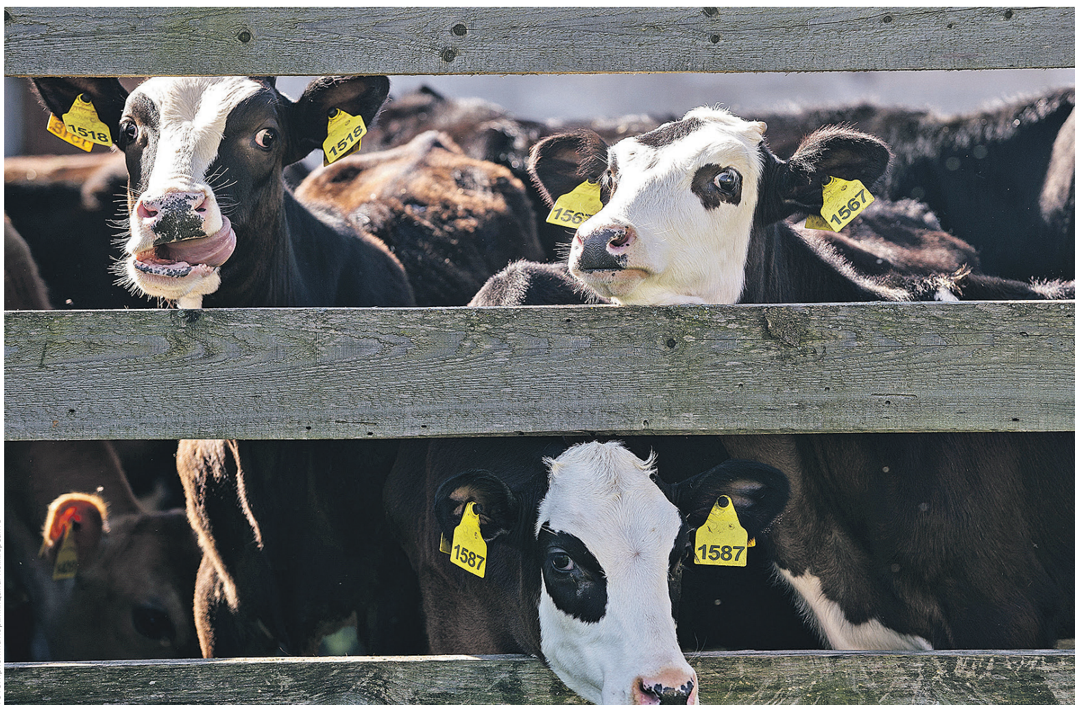
Компания-должник «Молкоагро» обрабатывает 3,5 тыс. га арендованных земель сельскохозяйственного назначения и имеет стадо крупного рогатого скота более 1 тыс. голов

Между тем юрист практики по разрешению споров Goltsblat BLP Станислав Добшевич отмечает, что практика включения в залоговую массу активов ООО довольно ши-