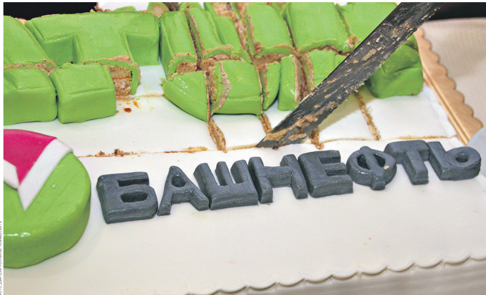
Президент «Башнефти» Александр Корсик оценивает приватизируемую долю компании в $3,76 млрд. Это на $0,76 млрд больше, чем ее оценил первый вице-премьер Игорь Шувалов