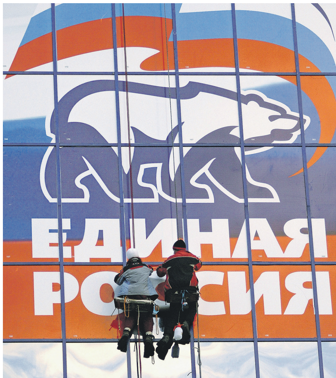
Многие руководители компаний, которые являются участниками госконтрактов, ориентируются на «Единую Россию» как на партию своих интересов, отмечает эксперт

Зачастую, после того как компания становится донором «Единой России», она начинает регулярно получать госконтракты, замечают эксперты. Например, ЗАО «Ин-