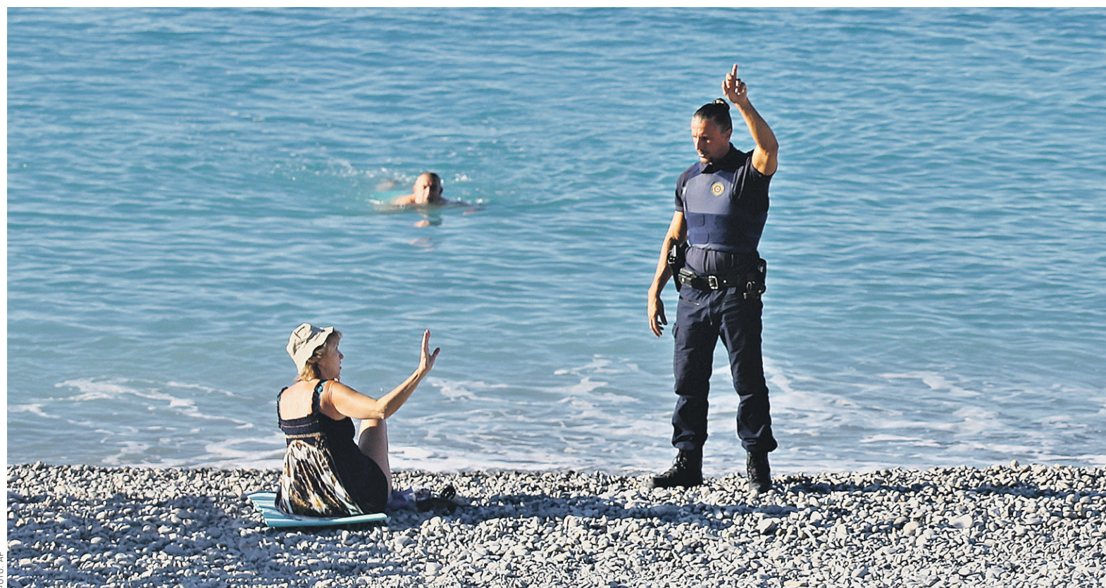
Теракт в Ницце может повлиять на туристическую отрасль сильнее, чем теракты в Париже, отмечает эксперт. На фото: полицейский просит отдыхающих покинуть пляж в Ницце, 16 июля