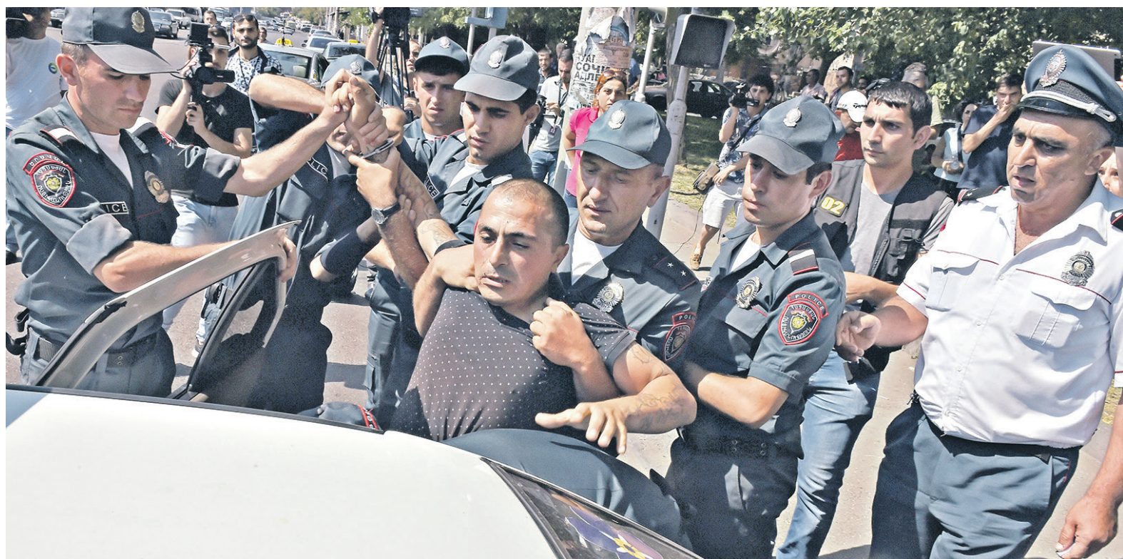
Члены движения «Учредительный парламент», захватившие здание отделения полиции в Ереване, не исключают никаких методов борьбы с оппонентами. На фото: один из задержанных у захваченного здания