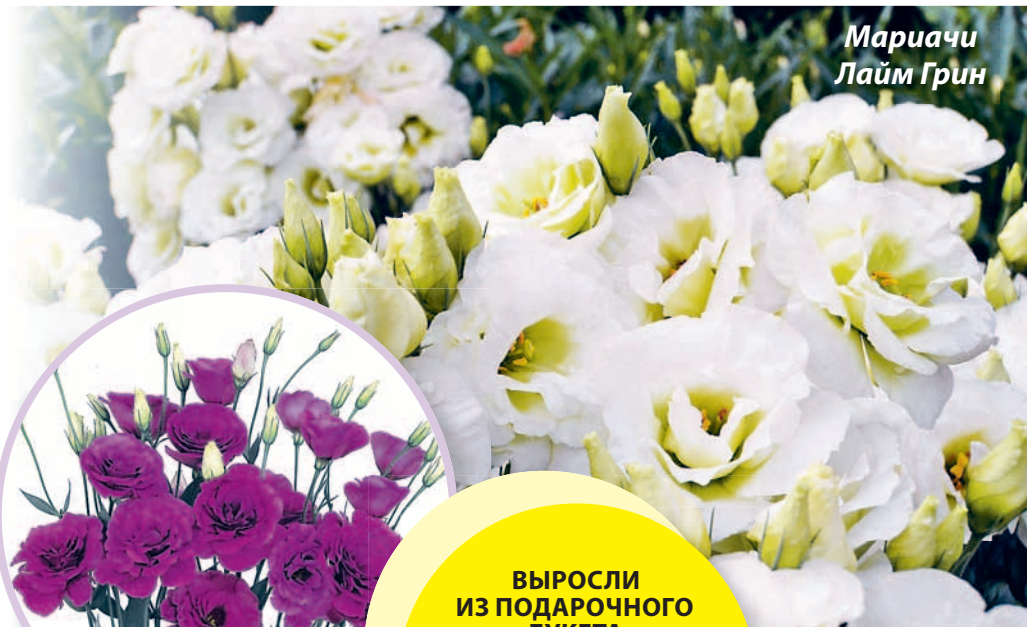
Мариачи Лайм Грин