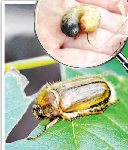
Июньский хрущ. Жуки объедают листья плодовых деревьев, кустарников малины, хвою сосны. Личинки повреждают корневую систему плодовых деревьев, овощных культур.