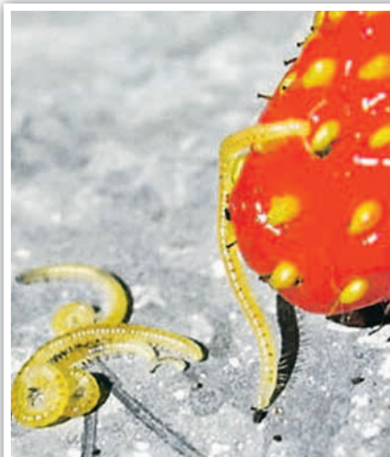
Земляничная нематода. Один из самых опасных вредителей клубники и земляники. Зараженные кусты плохо растут, цветы и завязи деформируются.