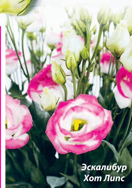
Эскалибур Хот Липс