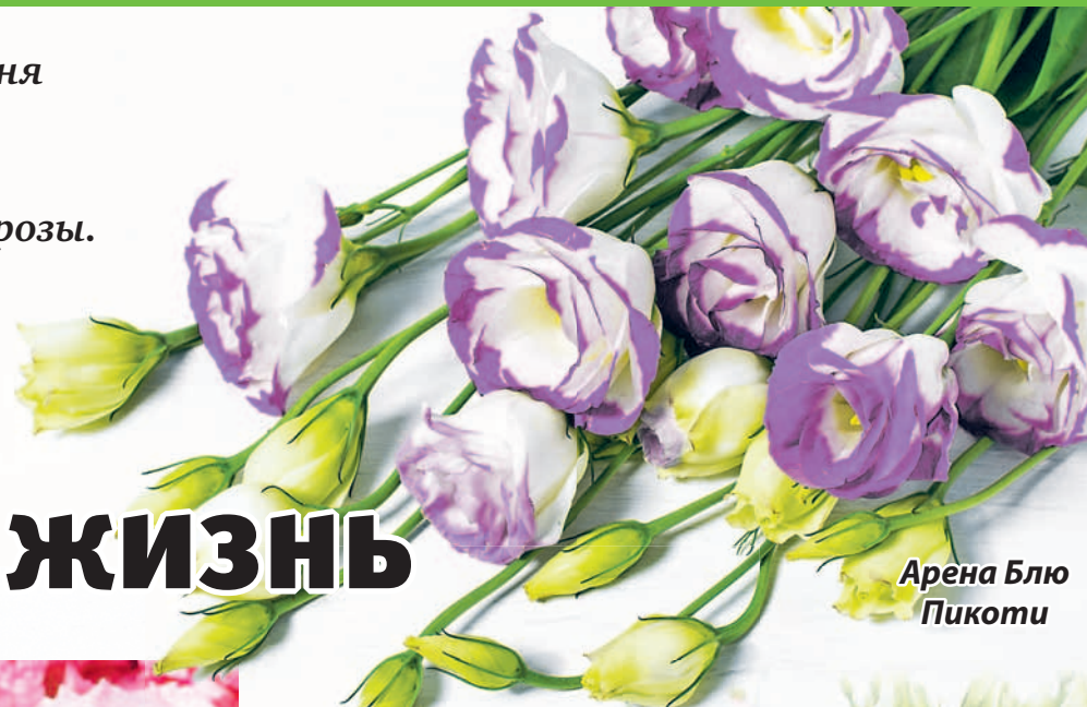
Арена Блю Пикоти

ПЕРВОЕ ВРЕМЯ Я СТАЛКИВАЛАСЬ С ТЕМ, ЧТО РАСТЕНИЕ НЕ УСПЕВАЕТ ЗА СЕЗОН ПОЛНОЦЕННО РАСЦВЕСТИ – ПОДХОДИТ ОСЕНЬ, А НА ЭУСТОМЕ ТОЛЬКО БУТОНЫ. ЕЙ НУЖНО ОТ 15 ДО 20 НЕДЕЛЬ С МОМЕНТА ПОСЕВА СЕМЯН, ЧТОБЫ ЗАЦВЕСТИ. В ТАКИХ СЛУЧАЯХ Я ПРИВОЗИЛА СВОИ ЭУСТОМЫ ДОМОЙ В ВАЗОНАХ И СЕЛИЛА ИХ НА УТЕПЛЕННОЙ ЛОДЖИИ НА ВОСТОЧНОЙ СТОРОНЕ. ОНИ ЕЩЕ ДОЛГО ЦВЕЛИ И РАДОВАЛИ МЕНЯ.