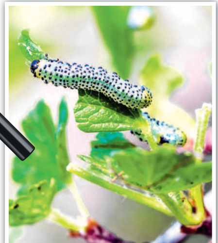
Крыжовниковый пилильщик. Личинки объедают до жилок листья крыжовника. Ягоды формируются мелкими, часть из них преждевременно опадает.