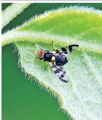
Вишневая муха. Личинки вредят черешне, вишне, абрикосу и жимолости, развиваясь в плодах и питаясь их мякотью. Поврежденные плоды темнеют, загнивают.